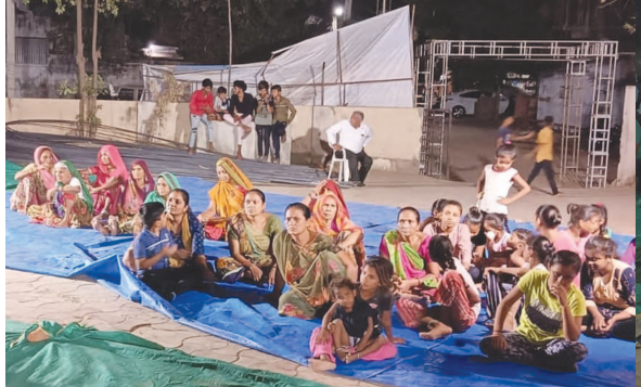
પ્રમુસ્વામી મહારાજ શતાબ્દી ઉત્સવ નિમિત્તે અમિયાપુર ગામ ખાતે જરેશ્વર મહાદેવના મંદિરમાં 'આપનું ગામ આદર્શ ગામ' વિષય પર વિશેષ સભા નું આયોજન BAPS સંસ્થા અને ગાંધીનગર અક્ષરધામના સંતોની ઉપસ્થિતિમાં ૧૪ મી ના રોજ કરવામાં આવ્યું હતું.