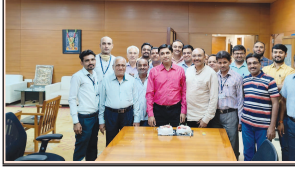
મહેસુલ મંત્રીના અંગત સચિવના જન્મદિવસની સ્ટાફે ઉજવણી કરી