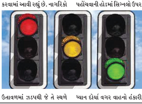
કરવામાં આવી રહ્યું છે. નાગરિકો પહોંચવાની હોડમાં સિગ્નલો ઉપર ઉતાવળમાં ઝડપથી જે તે સ્થળે ધ્યાન દોર્યા વગર વાહનો હંકારી

કારણો નિર્દોષ વ્યક્તિને જીવ ગુમાવવાનો વારો આવે છે. ગાંધીનગરમાં ટ્રાફિક વ્યવસ્થાઓ જળવાઈ રહે તે માટે દરેક માર્ગો પર ચાર રસ્તાઓ પર ટ્રાફિક સિગ્નલો લગાવ્યા છે જેમાં મોટા ભાગે ટ્રાફિક રુલનો ભંગ કરવામાં આવી રહ્યો છે. પહેલા શરૂઆતમાં ટ્રાફિક પોલીસની હયાતીમાં ટ્રાફિક થોભતો હતો જ્યારે હવે ટ્રાફિક પોલીસની ગેરહાજરીમાં શહેરમાં ટ્રાફિકના નિયમોનું સરેઆમ ઉલ્લંઘન