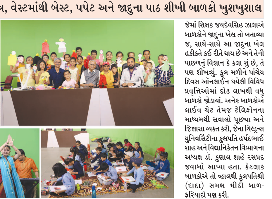
વેકેશનમાં સંગીત, ચિત્ર, વેસ્ટમાંથી બેસ્ટ, પપેટ અને જાદુના પાઠ શીખી બાળકો પુશપુશાલ