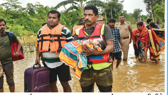
આસામમાં આવેલા આ કુદરતી પ્રકોપે પોતાનું જીવન વિતાવવા મજબૂર બન્યા છે. અસમના ૨૮ જિલ્લાઓમાં ૭.૧૨ લાખ લોકો આ પુરનો પ્રકોપ ઝેલી રહ્યાં છે. જેના કારણે લોકોનું જીવન પણ અસ્તવ્યસ્થ થઈ ગયું છે. એક રિપોર્ટ પ્રમાણે અસમ રાજ્યમાં આવેલ આ કુદરતી આફતના કારણે અત્યાર સુધી કુલ ૧૪ લોકો જીવ ગુમાવી ચૂક્યાં છે. આસામના નગરોમાં ૩.૩૬ લાખથી વધુ, કછરમાં ૧.૬૬ લાખ, હોજઈમાં ૧.૧૧ લાખ અને દરંગમાં ૫૨,૭૦૮ લોકો પ્રભાવિત થયા છે. ૨૦ મે ના રોજ કછર, લખીમપુર અને નગાંવ જિલ્લામાં પુરના કારણે ડૂબવાથી ૨ લાખથી વધુ લોકોના મોત થઈ ગયા છે. અસમમાં પુરના કારણે ભૂસ્ખલન થવાથી ૮ લોકો પોતાનો જીવ ગુમાવી ચૂક્યાં છે.

ખેડૂતને સોથી વધુ નુકશાન થયું છે આ પુરના કારણે ૮૦,૦૩૬.૯૦ હેક્ટર ખેતીની જમીનને નુકશાન થયું છે, તો અસમમાં ૨૨૫૧ ગામડાઓ અત્યારે પણ જળમગ્ન છે.