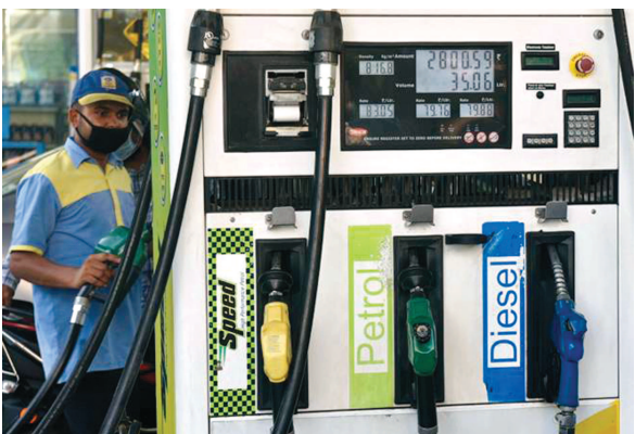
સમયથી સતત પેટ્રોલ ડીઝલના ભાવમાં સતત વધારો થતો જોવા મળ્યો છે. ત્યારે કેન્દ્ર સરકાર તરફથી આમ જનતા માટે રાહતના સંકેતો આપવામાં આવ્યા છે.

નવી દિલ્હી, તા. ૨૧ મે ૨૦૨૨ : કેન્દ્ર સરકારે પેટ્રોલ અને ડીઝલના ભાવમાં ઘટાડો કરી આજે સવારે ૫ વાગ્યા પછી પેટ્રોલના ભાવમાં ૯.૫ રૂપિયા