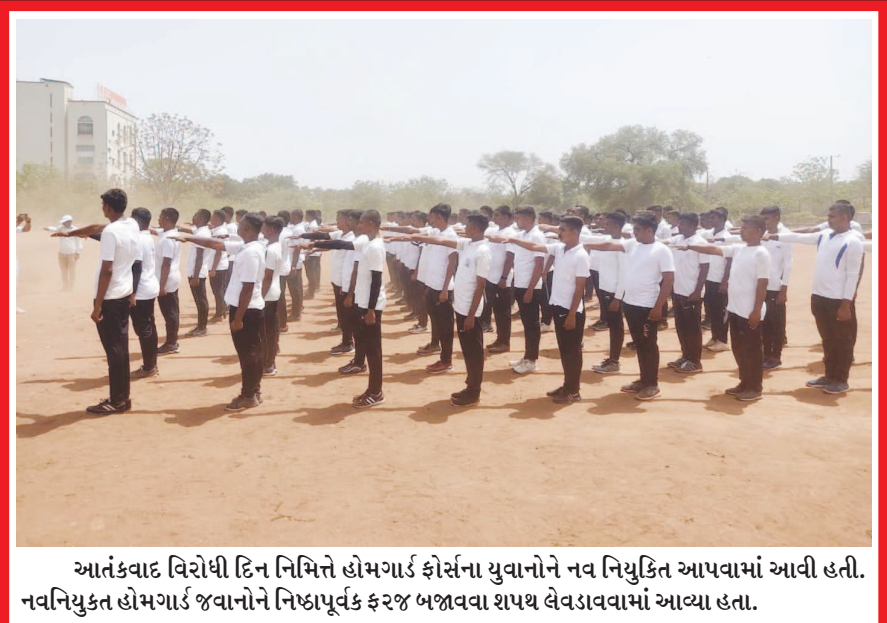
આતંકવાદ વિરોધી દિન નિમિત્તે હોમગાર્ડ ફોર્સના યુવાનોને નવ નિયુક્તિ આપવામાં આવી હતી. નવનિયુક્ત હોમગાર્ડ જવાનોને નિષ્ઠાપૂર્વક ફરજ બજાવવા શપથ લેવાડાવામાં આવ્યા હતા.

સમસ્યાઓ વધી રહી છે. વાહનચાલકોને આંખમાં વધાર પડતા આંખો અંજાઈ જાય તેવી સ્થિતિ સર્જાય છે. આ રીતે ઉડતા વધારના કારણે આંખોની ગંભીર બિમારીઓ થાય છે, તેથી વેપારીઓએ યોગ્ય રીતે વ્યવસ્થા કરવી અનિવાર્ય રહેશે. ગૃહિણીઓ ઘરે કોઈ પણ ખાદ્ય સામગ્રીઓ બનાવે છે ત્યારે આસપાસના નાગરિકોને પણ વધારની સુગંધ મળી જાય છે. પરંતુ ગેસની ચીમનીની વ્યવસ્થા હોવાથી વધાર સીધો અંદર જાય છે અને કોઈને નુકસાન થતું હોતુ નથી. જ્યારે આ માર્ગેના કુટાણા પર લારીઓમાં ઉડતી વધાર આંખમાં પડી રહી છે અને આંખ અને શ્વાસની બિમારીઓ થવાની દહેશત વર્તાય છે જેથી વેપારીઓએ યોગ્ય વ્યવસ્થા પ્રજાહીતમાં કરવી જોઈએ.