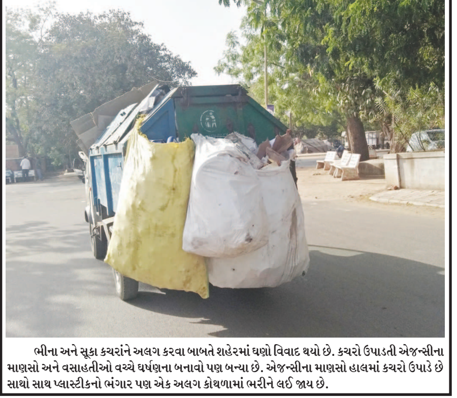
ભીના અને સુકા કચરાને અલગ કરવા બાબતે શહેરમાં ઘણો વિવાદ થયો છે. કચરો ઉપાડતી એજન્સીના માણસો અને ઘસાહતીઓ વચ્ચે ઘર્ષણના બનાવો પણ બન્યા છે. એજન્સીના માણસો હાલમાં કચરો ઉપાડે છે સાથે સાથે પ્લાસ્ટીકનો ભંગાર પણ એક અલગ કોષ્ટકમાં ભરીને લઈ જાય છે.

કરવા ગુજરાત સાયન્સ સિટી ખાતે આંતરરાષ્ટ્રીય જૈવવિવિધતા દિવસની ઉજવણી કરવામાં આવી. ઉજવણી અંતર્ગત યોજાયેલ એશનમાં વિદ્યાર્થીઓને જૈવ વિવિધતા શું છે? અને આદતોમાં નાના ફેરફારોથી આ જૈવવિવિધતા ને કેવી રીતે સાચવી શકાય તે વિષે જાણકારી આપવામાં આવી. વિદ્યાર્થીઓ આ અંતર્ગત પ્રતિજ્ઞા પણ લીધી. આ ઉજવણી દરમિયાન વિદ્યાર્થીઓએ રોબોટિક્સ ગેલેરી, અકવેટિક ગેલેરી, અને લાઈફ સાયન્સ પાર્કની મુલાકાત લઈ વિવિધ જીવો અને વનસ્પતિઓ વિશે જાણકારી મેળવી. ગુજરાત સરકારના વિજ્ઞાન અને પ્રોધોગિકી