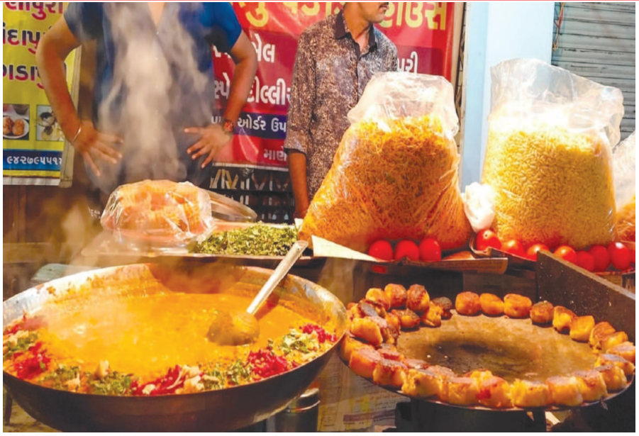
રચના એ રીતે બનાવવી જોઈએ કે વધાર કરતી વખતે તે આસપાસના વ્યક્તિને સીધો આંખમાં ન પડે. હાલમાં વાતાવરણમાં હવાનું જોર વધી રહ્યું છે. શહેરમાં પવન ફૂંકાઈ રહ્યો છે. પવનના કારણે આવી

ગાંધીનગર, તા. ૨૧ ગાંધીનગરમાં ખાણી-પીણી બજારો જોરશોરથી ધમધમી રહ્યા છે. સેક્ટર-૨૧ માર્કેટ, સેક્ટર-૨૪ માર્કેટ, સેક્ટર-૧૧માં ખાણી-પીણીની લારીઓ ધમધમી રહી છે ત્યારે નોનવેજ હોય કે વેજ ખાદ્યસામગ્રીની બનાવટ દરમિયાન ઉડતા વધારના કારણે આસપાસના નાગરિકો તથા વાહનચાલકોને આંખમાં સીધો વધાર પડવાથી મુશ્કેલીઓ થઈ રહી છે. વધાર સીધો આંખમાં જવાથી આંખને નુકસાન પહોંચે છે. ગાંધીનગરમાં નોનવેજની લારીઓ વાણી પસાર થતા વાહનચાલકોને ટુંઘાં અને વધારનો સીધો મારો સહન કરવો પડી રહ્યો છે. શહેરમાં ખાણી-પીણીવાળા વેપારીઓને યોગ્ય વ્યવસ્થા કરીને લારીઓની