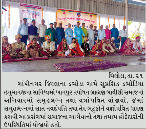
ગાંધીનગર જિલ્લાના ડભોડા ગામે સુપ્રસિદ્ધ ડભોડિયા હનુમાનજીના સાનિધ્યમાં ખાનપુર તપોધન બ્રાહ્મણ બાવીશી સમાજનો અગિયારમો સમુહ લગ્ન તથા યજ્ઞોપવિત યોજાયો. જેમાં સમુહલગ્નમાં સાત નવદંપતિ તથા તેર બટુકોને યજ્ઞોપવિત ધારણ કરાવી આ પ્રસંગમાં સમાજના આગેવાનો તથા તમામ હોદ્દાદારોની ઉપસ્થિતિમાં યોજાયો હતો.