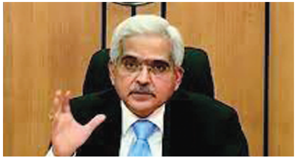
દ્વારા પગલાં લેવાશે. કુગાવાનો દર સર્ગળ ચાર મહિના સુધી ૬ ટકાથી ઉપર રહેતા સેન્ટ્રલ બેન્કે ચાલુ મહિને રેપો રેટમાં ૦.૪૦ ટકાનો વધારો કરીને રેપો રેટ ૪.૪ ટકા કર્યો હતો. ૬થી ૮ જૂન દરમિયાન રિઝર્વ બેન્કે કેશ રિઝર્વ રેશિયો (CRR)માં પણ ૫૦ બેસિસ પોઇન્ટનો વધારો કરીને સીઆરઆર ૪.૫ ટકા કર્યો હતો. તેનાથી બેન્કિંગ સિસ્ટમમાંથી ૮૫,૦૦૦ કરોડની લિક્વિડિટી બેંચાઈ ગઈ હતી. શક્તિકાંત દાસે એક મુલાકાતમાં જણાવ્યું હતું કે આપણે કુગાવાને અંકુશમાં રાખવા માટે ફિસ્કલ અને મોનેટરી ઓથોરિટી વચ્ચે સંકલન શરૂ કર્યું છે. આ પગલાંથી કુગાવો થોડો ઘટશે.

એપ્રિલ મહિનામાં ભારતનો રિટેલ કુગાવાનો દર આઠ વર્ષની ટોચ પર હતો જેના કારણે સેન્ટ્રલ બેન્કની સહનશીલતાની હદ આવી ગઈ હતી અને તેણે રેટમાં વધારો કરવો પડ્યો હતો. RBIએ તાજેતરમાં વ્યાજદરમાં વધારો કર્યા બાદ તમામ મહત્વની બેન્કોએ તરત તેના લોનના રેટ અને ડિપોઝિટ રેટમાં વધારો કરી દીધો હતો. SBI, HDFC બેન્ક, બેન્ક ઓફ બરોડા, ICICI બેન્ક સહિતની બેન્કોએ RBIના પગલાં પછી લોનના દર વધારી દીધા હતા જેના કારણે લોન પર EMI અથવા લોનનો સમયગાળો વધી ગયો છે.