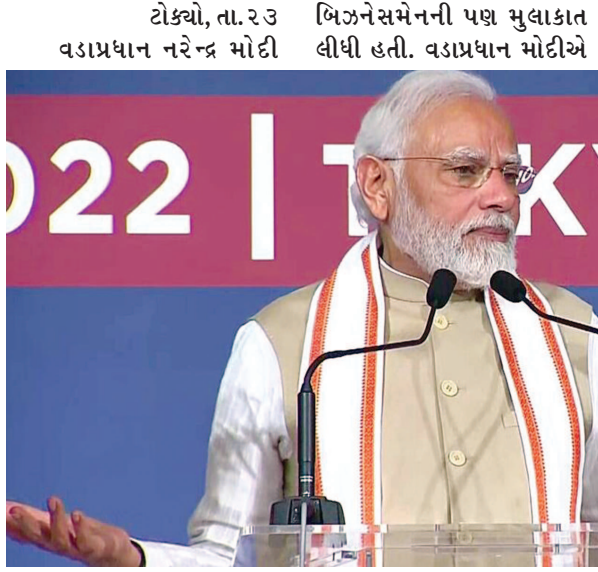
ટોક્યો, તા. ૨૩ વડાપ્રધાન નરેન્દ્ર મોદી બિઝનેસમેનની પણ મુલાકાત લીધી હતી. વડાપ્રધાન મોદીએ કોર્પોરેશનના ચેરમેને વડાપ્રધાન મોદીની કામગીરીની ભારે પ્રશંસા કરી હતી.

ક્વાડ શિખર સંમેલન માટે મોદી જાપાનના પ્રવાસે : ભારતીય વડાપ્રધાને જાપાનના અનેક ટોચના બિઝનેસમેનની પણ મુલાકાત લીધી : સુઝુકી મોટર કોર્પોરેશનના ચેરમેને મોદીની કામગીરીની પ્રશંસા કરી