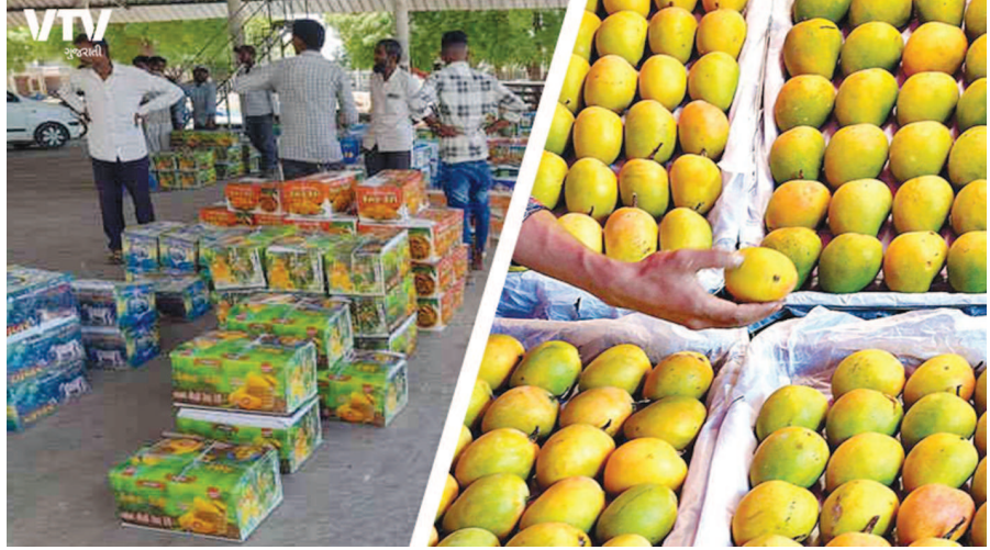
જાણે હવે જ શરૂ થઈ હોય એમ શહેરના બજારોમાં કેસર કેરી ઓન ડિમાન્ડમાં છે. સામાન્ય

મજા માણવા માટે કેરીની ખરીદી વધી રહી છે. શહેરની જગતો મોંઘવારીના માર વચ્ચે સ્વાદિષ્ટ કેરીઓની ખરીદી કરવા ઉમટી રહ્યા છે. સેક્ટરે સેક્ટરે લારીઓમાં કેરીઓનું વેચાણ શરૂ થઈ ગયું છે. કેરીઓને જોતા જ ખરીદી કરવાનો ઈરાદો થાય તેવી આકર્ષક કેરીઓનું બજારમાં આગમન થઈ ચૂક્યું છે. શહેરમાં સચિવાલયની આસપાસ કેરીની અટ્ટળક ખરીદી થઈ રહી છે. આ સાથે ફળોના બજારોમાં ગયા માસ કરતા બમણી ખરીદી કરવામાં આવી રહી છે. જેમાં તમામ પ્રકારની કેરીઓમાંથી બદામ કેરીની ડિમાન્ડ વધારે છે. શહેરની જગતો સૌથી વધુ ખરીદી બદામ કેરીની કરી રહ્યા છે.