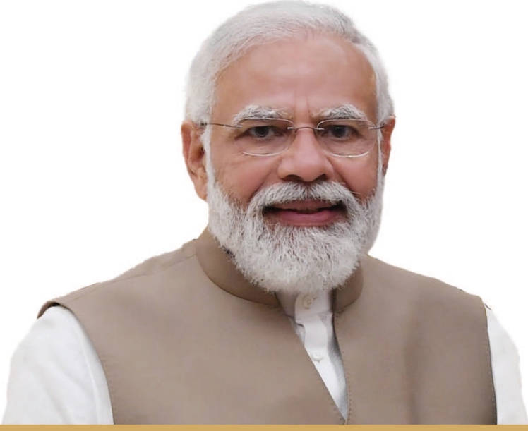
શ્રી નરેન્દ્રભાઈ મોદી માન. વડાપ્રધાન

આવો, સહુ સાથે મળી, સહકારી ચળવળને વેગવંતી બનાવીએ