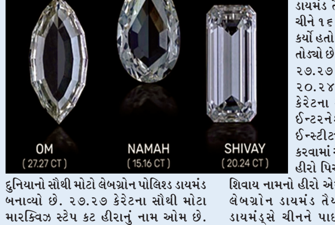
ડુનિયાનો સૌથી મોટો લેબગ્રોન પોલિશ ડાયમંડ બનાવ્યો છે. ૨૭.૨૭ કેરેટના સૌથી મોટા મારકિટવલ રેપ કટ હીરાનું નામ ઓમ છે. ગ્લોબલ ડાયમંડ સર્ટિફિકેશન ઓર્ગેનાઈઝેશન ઈન્ટરનેશનલ જેમ્સલોજિકલ ઈન્સ્ટીટ્યૂટ દ્વારા ઓમને પ્રમાણિત કરવામાં આવ્યો છે.