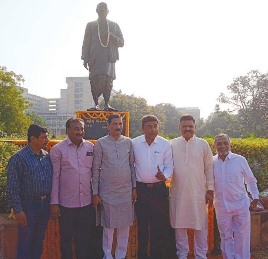
ગુજરાતના પનોતા પુત્ર એવા સરદાર વલ્લભભાઈ પટેલની ૧૪૭મી જન્મ જયંતિ નિમિત્તે વિવિધ કાર્યક્રમો યોજવામાં આવ્યા હતા. ગાંધીનગર જિલ્લા લેઉવા પાટીદાર સમાજ દ્વારા વિધાનસભા પટંગણમાં પુષ્પાંજલિ અર્પણ કાર્યક્રમ યોજાયો હતો.