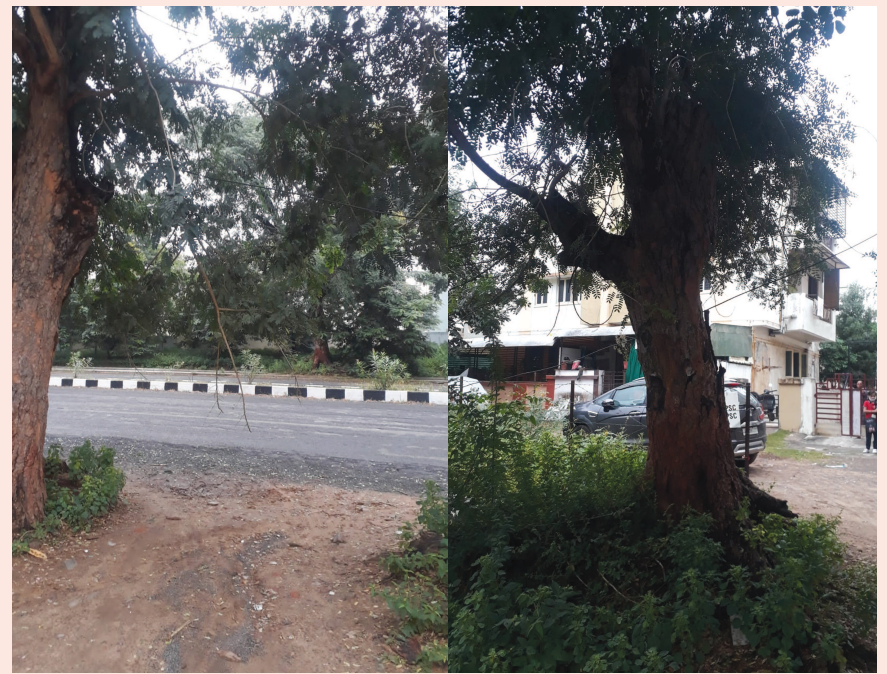
ગાંધીનગરમાં ગ-૨ સર્કલ પાસે સેક્ટર-૪૩ના કોર્નર પાસે માધવ કલેટની સામે પ્લોટ નં. ૮૦૩/૧ નજીક નાગરિકોના આવનજાવનના રસ્તાની બંને તરફના બે વૃક્ષોને મૂળમાંથી ઉધઈ લાગી જવા પામી છે જેના કારણે તે ગમે ત્યારે પડી જાય તેવી શક્યતા હોવાથી મોટો અકસ્માત સર્જવાની ભીતિ છે. આ કારણે આસપાસના રહીશો દ્વારા બંને વૃક્ષોને પાકી નાંખવામાં આવે તેવી અપેક્ષા વ્યક્ત કરી રહ્યાં છે.

શું આ હોનારત માટે જવાબદાર તત્ત્વો સામે પગલાં લેવાશે કે પછી અત્યારે ધરપકડના નાટકો કરીને પછી અન્ય દુર્ઘટનાઓની જેમ સમય જતાં ભીનું સંકેલી લેવાશે? આ દુર્ઘટનાને કારણે આગામી ગુજરાત વિધાનસભાની ચુંટણીઓમાં ખાસ કરીને સૌરાષ્ટ્ર વિસ્તારની બેઠકો છે જે સરકાર રચવામાં મહત્વપૂર્ણ ગણાય છે તેના પર કેવી અસરો પડશે? આવાં તો અનેક સવાલો આ ચોરેને ચોટે પુછાઈ રહ્યાં છે. અત્યારે શહેરના નાગરિકોના સોશિયલ મિડીયા એકાઉન્ટ પર પણ મોરબી હોનારત અંગે અનેક પોસ્ટ જોવા મળી છે અને આક્રોશ વ્યક્ત કરાઈ રહ્યો છે.