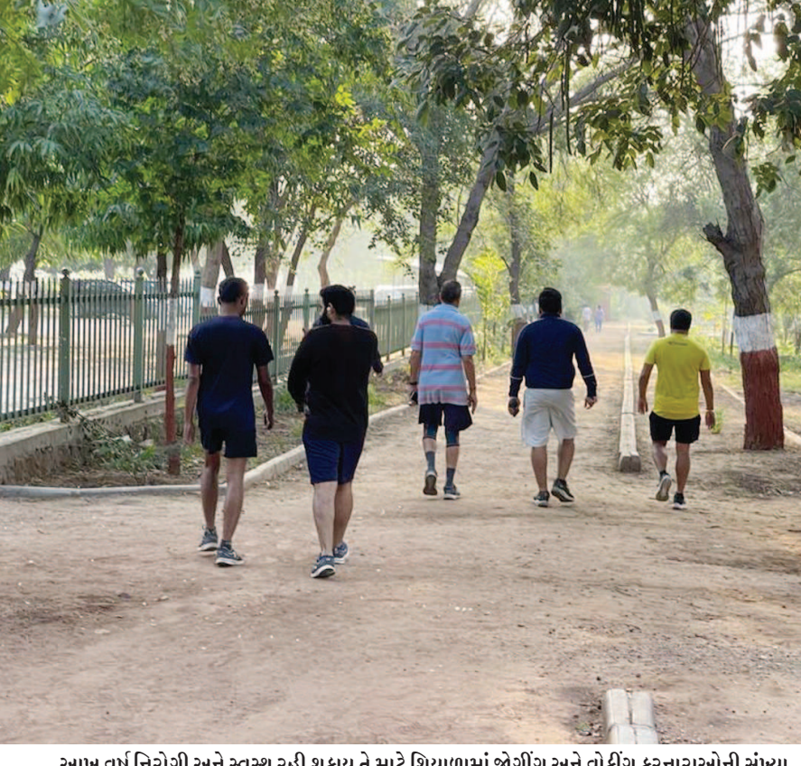
આમુ વર્ષ નિરોગી અને સ્વસ્થ રહી શકાય તે માટે શિયાળામાં જોગીંગ અને વોકીંગ કરનારાઓની સંખ્યા વધી જાય છે. શિયાળા દરમ્યાન કરવામાં આવતી શારીરિક પ્રવૃત્તિઓ ઊર્જા પૂરી પાડે છે. શિયાળાનું ધીમા પગલે આગમન શરૂ થયું છે. ત્યારે શહેરના બગીચાઓમાં ભીડ જામવા માંડી છે. સેન્ટ્રલવિસ્ટાના બગીચામાં મોર્નિંગ વોક કરનારાઓની સંખ્યા ધીમે ધીમે વધી રહી છે.

ગાંધીનગર, તા. ૩૧ ગાંધીનગર જિલ્લાના ગ્રામ્ય વિસ્તારમાં આજે કોરોનાના બે કેસ નોંધાયા છે. શહેરમાં આજે કોરોનાનો એક પણ કેસ નોંધાયો નથી. ગ્રામ્ય વિસ્તારમાં એક સમાહ બાદ કોરોનાના કેસોએ દેખા દીધી છે. ગ્રામ્ય વિસ્તારમાં આજે નોંધાયેલ બન્ને કેસ લોકલ ટ્રાન્સમિશનના હોવાનું જાણવા મળેલ છે. ગાંધીનગર શહેર-જિલ્લામાં લોકલ ટ્રાન્સમિશનથી જ કેસો નોંધાઈ રહ્યા હોવાથી તંત્રની ચિંતા વધી છે. લોકલ ટ્રાન્સમિશનને નાથવા સોશયલ ડિસ્ટન્સીંગ જાળવવા સાથે કોરોના ગાઈડલાઈનના પાલન માટે તેમજ વેક્સિનેશન અભિયાન સઘન બનાવવા માટે તંત્રએ સૂચનાઓ આપી છે. જિલ્લાના ગ્રામ્ય વિસ્તારમાં આજે બે કેસ નોંધાયા છે. બન્ને કેસ મહિલા દર્દીના છે. મહિલા દર્દીઓની વધતી જતી સંખ્યાને લઈ પણ તંત્ર ચિંતિત છે. આજે બન્ને કેસ માણસા તાલુકામાં નોંધાયા છે. માણસાના મકાખાડ ગામે ૨૮ વર્ષીય મહિલા તેમજ માણસા શહેરમાં ૩૫ વર્ષીય મહિલાનો રિપોર્ટ પોઝીટીવ આપ્યો છે. આ બન્ને મહિલા દર્દીએ હોમ આઈસોલેશનનો વિકલ્પ સ્વીકાર્યો છે. જિલ્લાના ગ્રામ્ય વિસ્તારમાં આજે એક દર્દી રિકવર થતાં તેને ડિસ્ચાર્જ આપવામાં આવેલ છે. જિલ્લાના ગ્રામ્ય વિસ્તારમાં આજે ૧૭૨ લોકોને હોમ આઈસોલેટ કરવામાં આવ્યા છે. શહેર-જિલ્લામાં મોટા ભાગના દર્દીઓ હાલ હોમ આઈસોલેશનમાં સારવાર હેઠળ હોઈ હોમ આઈસોલેશનના નિયમોની અમલવારી અસરકારક રીતે થાય તે જોવા સૂચનાઓ આપવામાં આવી છે.