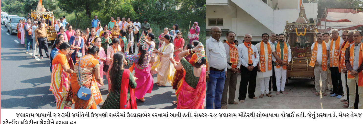
જલારામ બાપાની ૨૨૩મી જયંતિની ઉજવણી શહેરમાં ઉલ્લાસભર કરવામાં આવી હતી. સેક્ટર-૨૮ જલારામ મંદિરથી શોભાયાત્રા યોજાઈ હતી. જેનું પ્રસ્થાન કે. મેયર તેમજ સ્ટેન્ડીંગ કમિટીના ચેરમેને કરાવ્યું હતું.