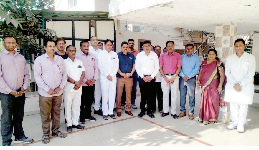
મોરબીમાં પુલ તુટવાથી બનેલી ઘટનામાં મૃત્યુ પામેલા સ્વજનોને કોંગ્રેસ દ્વારા શ્રદાંજલી પાઠવવામાં આવી હતી. કોંગ્રેસ કાર્યાલય ખાતે યોજાયેલ આ શ્રદાંજલી કાર્યક્રમમાં કોંગ્રેસના આગેવાનો અને કાર્યકરો મોટી સંખ્યામાં ઉપસ્થિત રહ્યા હતા.

ગાંધીનગર, તા. ૩૧ ગાંધીનગરના હાઈ સમા સેક્ટર-૨૨ માં બિસ્માર માર્ગોને કારણે વાહનચાલકોને ભારે પરેશાનીનો સામનો કરવો પડી રહ્યો છે. નવી ગટર-પાણીની પાઈપલાઈન સહિતના વિવિધ વિકાસ કાર્યોને પગલે કરાયેલાં ખોદકામ બાદ અપુરતા માટી પુરાણ અને રોડના યોગ્ય મરામતના અભાવે બિસ્માર બનેલાં માર્ગો પર હાંકવું તો ઠીક પરંતુ પાર્ક કરવું પણ સમસ્યારૂપ બન્યું છે, મોટાભાગની સોસાયટીઓના આંતરિક માર્ગો પણ અત્યંત ઉભડખાબડ છે. પંચદેવ મંદિરથી ગીતા કેમિસ્ટ થઈને જૈન મંદિર તરફ જતાં મુખ્ય માર્ગ પરના ખાડાઓ અને વારંવાર સર્જાતા ટ્રાફિક જામને કારણે અહીંથી પસાર થવું પણ વાહનચાલકો માટે માથાના દુઃખારૂપ બન્યું છે.