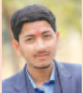
જસજિતસિંહ પ્રેમલસિંહ ગોલ