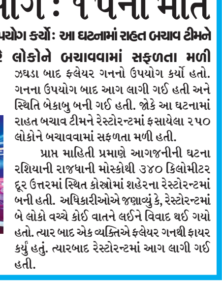
થઈ ગયા છે. અધિકારીઓએ જાણકારી આપી છે કે, કેફેમાં આગ ત્યારે લાગી જ્યારે કોઈ વ્યક્તિએ

કેફે વ્યક્તિએ ગદાડા બાદ ફ્લેયર ગળનો ઉપયોગ કર્યો : આ ઘટનામાં રાહત બચાવ ટીમને રેસ્ટોરન્ટમાં ફસાયેલા ૨૫૦થી વધારે લોકોને બચાવવામાં સફળતા મળી ઝથડા બાદ ફ્લેયર ગળનો ઉપયોગ કર્યો હતો. ગળના ઉપયોગ બાદ આગ લાગી ગઈ હતી અને સ્થિતિ બેકાબુ બની ગઈ હતી. જોકે આ ઘટનામાં રાહત બચાવ ટીમને રેસ્ટોરન્ટમાં ફસાયેલા ૨૫૦ લોકોને બચાવવામાં સફળતા મળી હતી. પ્રાપ્ત માહિતી પ્રમાણે આગજનીની ઘટના રશિયાની રાજધાની મોસ્કોથી ૩૪૦ કિલોમીટર દૂર ઉત્તરમાં સ્થિત કોસ્ત્રોમાં શહેરના રેસ્ટોરન્ટમાં બની હતી. અધિકારીઓએ જણાવ્યું કે, રેસ્ટોરન્ટમાં બે લોકો વચ્ચે કોઈ વાતને લઈને વિવાદ થઈ ગયો હતો. ત્યાર બાદ એક વ્યક્તિએ ફ્લેયર ગળથી ફાયર કર્યું હતું. ત્યારબાદ રેસ્ટોરન્ટમાં આગ લાગી ગઈ હતી.