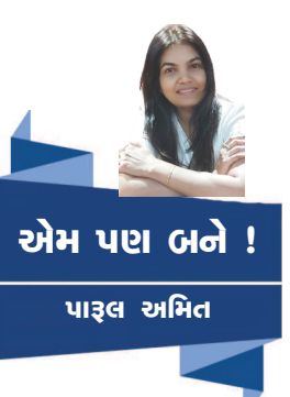
આમ પણ બને ! પાણલ અમિત

પણ શું દરેક વ્યક્તિ મહાનતા માટે જન્મી છે? પણ ખરા અર્થમાં આપણી અંદરની ઉર્જા એ જ મહાનતા અને સાચી દિશા. Parulamani198@gmail.com (7201001482)