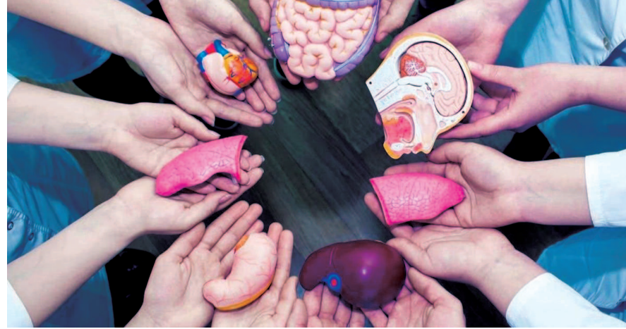
પહેલાં બ્રેઈન ડેડ અંગેની માહિતી અતિ જરૂરી છે. જે દર્દીનું મગજ ત્યારે બંધ કરી દેવામાં આવે છે! આ નીર્ણય સાથે શંકાઓ, અપરાધભાવ, પાપ-પુણ્યનો સરવાળો ઘણું ઘણું જોડાયેલું છે. આજે પણ સમાજના અનેક લોકોને અંગદાન અંગેની

વ્યક્તિનું બ્રેઈન ડેડ થાય તો તેના અવયવો સરળતાથી મળી શકે, જેનાથી અન્ય દર્દીને લાભ થાય. વ્યક્તિએ પોતાના સૌથી નજીકના કુટુંબીજનને એક અગત્યના ફોન દસ્તાવેજ પર સહી કરવાની હોય છે. જેથી કોઈ સંજોગોમાં અકસ્માતે મગજને ઈજા પહોંચે અને તમે બ્રેઈન ડેડ થાવ તો તમારા સંકલ્પ પ્રમાણે અંગદાન માં લઈ શકાય. શરીરના અવયવોનું દાન સ્ત્રી-પુરુષ બંને કરી શકે છે. તેમાં કોઈ પણ ઉંમર, ધર્મ કે જાતિ હોય તેની સાથે કોઈ નિસબત નથી. કોઈ ભેદભાવ નથી. કોઈ પણ વ્યક્તિ અંગદાન કરી શકે છે. બ્રેઈન ડેડ થયેલ દર્દીને અંગદાન કર્યું હોય તો ટ્રાન્સપ્લાન્ટની ટીમ બ્રેઈન ડેડ દર્દીનું તબીબી પરીક્ષણ કરીને અવયવોનું દાન કરવા યોગ્ય છે કે નહીં તે તપાસીને તેની ચકાસણી કરે છે. શરીરમાંથી અવયવ બહાર કાઢીને તેનું પ્રયાતોપણ કરવું એ એક વ્યવસ્થિત પ્રક્રિયા છે. તેમાં શરીરનું બિનજરૂરી ડિસ્કેશન કરવામાં આવતું નથી. તેના લીધે અંતિમવિધિમાં કોઈ પણ પ્રકારની અડચણ થતી નથી.