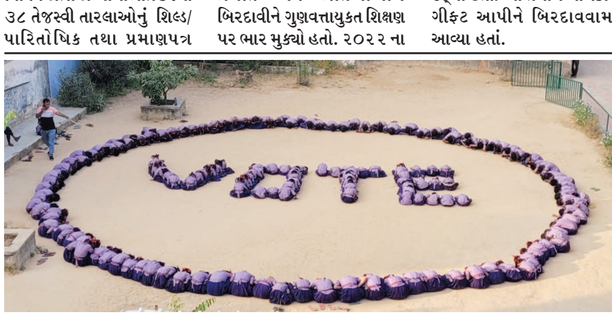
શાહપુર પ્રાથમિક શાળા ના બાળકોએ મતદાન જાગૃતિ અભિયાન અંતર્ગત વોટ (VOTE) ચિન્હની સાંકળ બનાવી મતદાન જાગૃતિનો ફરજિયાત મતદાનનો સંદેશો આપ્યો હતો.