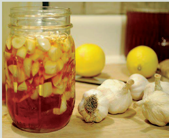
શકાય છે. સામાન્ય રીતે કોલેસ્ટ્રોલવાળો ખોરાક ખાવાની ખોટી આદતોને કારણે બગડવા લાગે છે. આવી સ્થિતિમાં તમારે લસણ અને મધનો ઉપયોગ બેલેન્સ કરવા માટે કરવો પડશે, જેનાથી હાર્ટ એટેકનું જોખમ પણ ઘટશે. લસણ અને મધનું સેવન કરવાથી ફંગલ

આજની ભાગદોડ ભરી જિંદગીમાં માણસ પોતાનું અને પોતાના શરીરનું ધ્યાન બરાબર રાખી શકતો નથી જેથી કરીને પાછળથી પસ્તાવાનો વારો આવે છે અને આમ પણ આપણા આયુર્વેદિક મા ઘણા બધા ઘરઘરથી ઉપાય બતાવવામાં આવ્યા છે. જેમ કે આપણા સૌથી પુરાણું દાદીમાનું વેદુમાંથી ઘણા બધા ઉપાય છે. લસણ અને મધના ફાયદાથી બધા પરિચિત છે. મધ અને લસણની જોડી ખૂબ જ ફાયદાકારક છે. શિયાળામાં મધ અને લસણ ખાવાના અનેક ફાયદા છે. બજારોમાં પણ લસણની ધૂમ આવક જોવા મળી રહી છે. હૃદયને સુરક્ષિત રાખવાની સાથે સાથે તે તમને ઘણી બીમારીઓથી પણ દૂર રાખે છે. તે ગળામાં દુઃખાવો ઘટાડવા માટે રોગપ્રતિકારક શક્તિ વધારવામાં પણ અસરકારક છે. વાસ્તવમાં, લસણ અને મધમાં એન્ટી-બેક્ટેરિયલ ગુણ હોય છે, જે ફંગલ ઇન્ફેક્શનને દૂર કરવા માટે ઉપયોગી છે. ચાલો જાણીએ કે, આ સિવાય આ મિક્સર તમને કયા કયા ફાયદા આપી શકે છે.