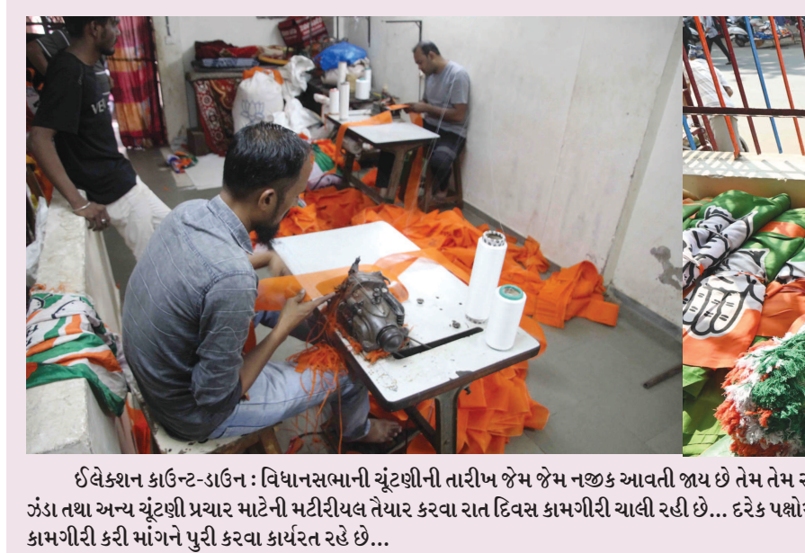
ઈલેકશન કાઉન્ટ-ડાઉન : વિધાનસભાની ચૂંટણીની તારીખ જેમ જેમ નજીક આવતી જાય છે તેમ તેમ રાજકીય માહોલ ગરમતો જાય છે... લાખોની સંખ્યામાં દુપકા, ખેસ, ટોપી, ઝંડા તથા અન્ય ચૂંટણી પ્રચાર માટેની મટીરીયલ તૈયાર કરવા રાત દિવસ કામગીરી ચાલી રહી છે... દરેક પક્ષમાં પ્રચાર સાહિત્યની માંગ તીવ્ર બની રહી છે ત્યારે કારીગરો પણ રાત-દિવસ કામગીરી કરી માંગેને પુરી કરવા કાર્યરત રહે છે...

નવી દિલ્હી, તા. ૧૬ ભારતમાં ફરી એક વખત ધરજી ધુલ્યું છે. છેલ્લા દિવસોમાં દિલ્હી સહિત ઉત્તર ભારતના અનેક વિસ્તારોને હચમચાવી દેનારા ભૂકંપે આ વખતે અરુણાચલ પ્રદેશના લોકોને આંચકો આપ્યો છે. નેશનલ સેન્ટર ફોર સિસ્મોલોજી પ્રમાણે અરુણાચલ પ્રદેશના લેપા રાડા જિલ્લામાં સ્થિત બસર વિસ્તારમાં આજે સવારે ૮:૫૫ વાગ્યે ભૂકંપના આંચકા