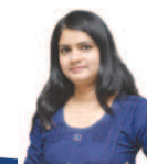
નખરાણી જિંદગી નિયતી કાપડીયા