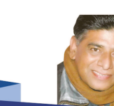
લાગણીનો મેજો રસિક વાળંદ

સાચું... મરી જઈશું. ની નાહક ભૂમરાણ મચાવતા કણસી રહે છે... મને ઘણીવાર વિચાર આવે કે જેમ શાળામાં માતૃભાષા કે કક્કો બારાક્ષરીથી શરૂઆત થાય પછી ક્રમશઃ હિન્દી... અંગ્રેજી... ઉપરાંત અન્ય વિષયોનો અભ્યાસક્રમ ચાલે છે... એમ આપું જીવનમાં હોય ખરું?! અમુક વર્ષો પછી વ્યક્તિનાં વાણી, વર્તન, વિચારમાં ભક્તિ, ઈશસ્પર્શ કે સજ્જનતાના પાઠ જીવનમાં પાકા કરવાના કે નહીં?! આ તો પહેલા ધોરણનો વિદ્યાર્થી કક્કો બારાક્ષરી કરે અને દસમાનો વિદ્યાર્થી પણ એ જ ગોખ્યા કરે... તો પછી બે ધોરણ વચ્ચે તફાવત શાનો?! નાનું બાળક આહાર-નિદ્રામાં રત... યુવાન ખાઈ-પીને જલસા કરે અને વૃદ્ધો પણ એમાં જ રચ્યાપરચ્યા રહે તો દાયકાઓ વિતાવેલા જીવનરતું મૂલ્ય શું?! દાયકાઓ વિતાવ્યા પછી કંઈક સિદ્ધ કર્યું હોય એવો