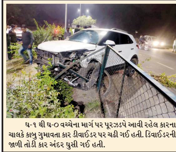
ધ-૧ થી ઘ-૦ વચ્ચેના માર્ગ પર પૂરઝડપે આવી રહેલ કારના ચાલકે કાબુ ગુમાવતા કાર ડીવાઈડર પર ચઢી ગઈ હતી. ડિવાઈડરની જાળી તોડી કાર અંદર ઘુસી ગઈ હતી.

ગાંધીનગર, તા. ૧૬ ગાંધીનગર જિલ્લાની પાંચેય વિધાનસભા બેઠકો પર આ વખતે ત્રિકોણીયો જંગ બેલાઈ રહ્યો છે. આજે સવારે ગાંધીનગર દક્ષિણ બેઠક પર આમ આદમી પાર્ટીના ઉમેદવાર દોલત પટેલે કલેક્ટર કચેરી ખાતે તેમના કાર્યકરો અને સગા-સબંધીઓ સાથે આવીને તેમની ઉમેદવારી નોંધાવી હતી. દોલત પટેલે ઉમેદવારી નોંધાવવા સાથે જણાવ્યું હતું કે તેઓ જીતશે તો આમ આદમી પાર્ટીના રાષ્ટ્રીય સંયોજક અરવિંદ કેજરીવાલના દિલ્હી મોડેલને અનુસરીને ગાંધીનગર દક્ષિણ બેઠકનો વિકાસ કરવા કાર્યરત રહેશે અને દક્ષિણ બેઠક પર સ્વાસ્થ્ય અને શિક્ષણ મામલે કામગીરી તેમની અગ્રિમતામાં રહેશે. પાટીદાર ઉમેદવાર દોલત પટેલને ટિકિટ આપી છે જ્યારે કોંગ્રેસના ઉમેદવાર હિમાંશુ પટેલ પણ પાટીદાર ઉમેદવાર છે અને બીજા તરફ કોંગ્રેસના ઉમેદવાર અલ્પેશ ઠાકોર પર દાવ બેલ્યો છે જેમના પર આ બેઠક પર તેઓ આયાતી ઉમેદવાર હોવાનો આક્ષેપ સાથે તેમનો ભાજપમાંથી જ ભારે વિરોધ થઈ રહ્યો છે ત્યારે આ બેઠક પરનો જંગ અત્યંત રસપ્રદ બનશે તેમાં શંકાને સ્થાન નથી.