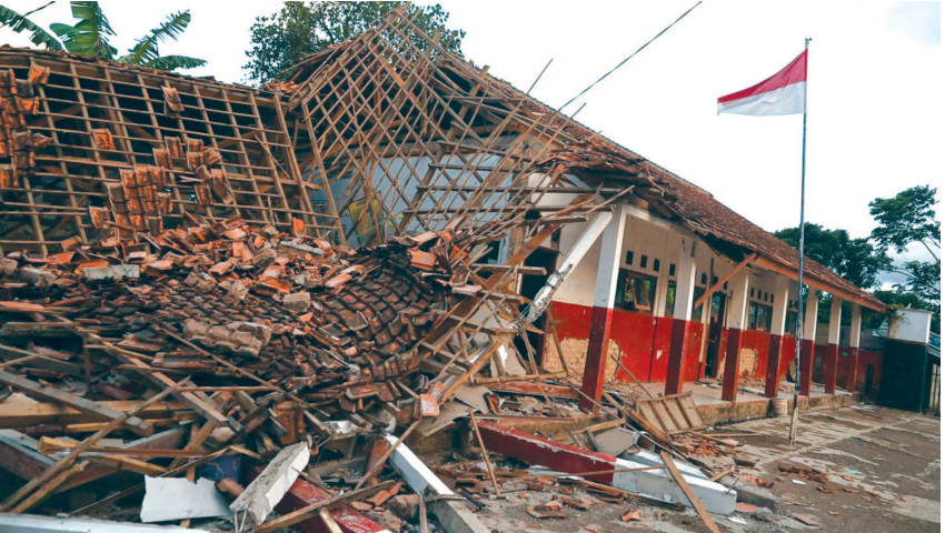
જમીનથી લગભગ ૧૦ કિલોમીટર દૂર હતું. હવામાન અને ભૂ-ભૌતિક એજન્સીએ કહ્યું કે હાલમાં સુનામીનો કોઈ ખતરો નથી. ભૂકંપ