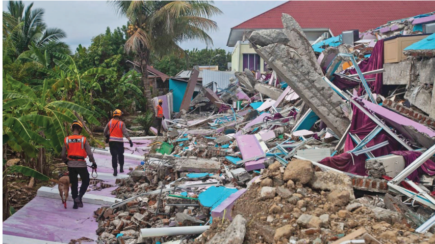
ઈન્ડોનેશિયા, તા. ૨૧ ઈન્ડોનેશિયામાં ફરીવાર ભૂકંપના આંચકાથી સમગ્ર દેશમાં ખળભળાટ મચી ગયો છે.

પડનાં મોત : ૭૦૦થી વધુ ઘાયલ : ભૂકંપના આંચકા એટલા તેજ હતા કે, અનેક બિલ્ડિંગ હલવા લાગી હતી : ઈન્ડોનેશિયામાં ભૂકંપનું કેન્દ્ર પશ્ચિમ જાવાના સિયાનુજરમાં જમીનથી લગભગ ૧૦ કિલોમીટર દૂર હતું, હાલમાં સુનામીનો કોઈ ખતરો નથી : ઈન્ડોનેશિયામાં ફરીવાર ભૂકંપના આંચકાથી ખળભળાટ