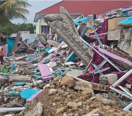
સોમવારે અહીં ભૂકંપના જોરદાર આંચકા અનુભવાયા હતા. આ ભૂકંપની તીવ્રતા રિક્ટર સ્કેલ પર ૫.૬ની તીવ્રતા માપવામાં આવી છે. આ જોરદાર આંચકા કેટલીક સેકન્ડો સુધી અનુભવાયા હતા. પ્રાથમ માહિતી પ્રમાણે આ ભૂકંપનું કેન્દ્ર પશ્ચિમ જાવાના સિયાનુજરમાં