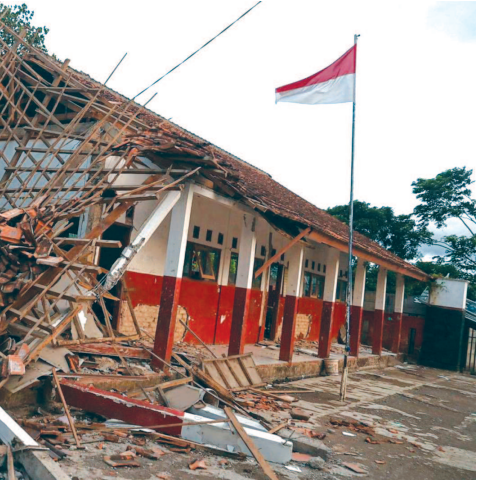
એટલો ગંભીર હતો કે, તેમાં અત્યાર સુધીમાં લગભગ ૫૬ લોકોના મોત થયા છે. આ ઉપરાંત ૭૦૦ થી વધુ લોકો ઘાયલ થયા છે