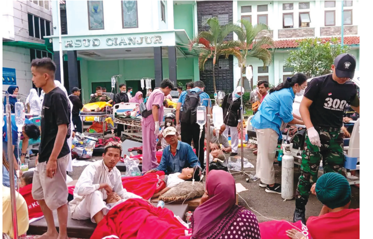
જેમની સારવાર ચાલી રહી છે. પ્રાથમ માહિતી પ્રમાણે જકાર્તામાં જ્યારે આ ભૂકંપ આવ્યો તે સમયે અનેક લોકો પોતાની