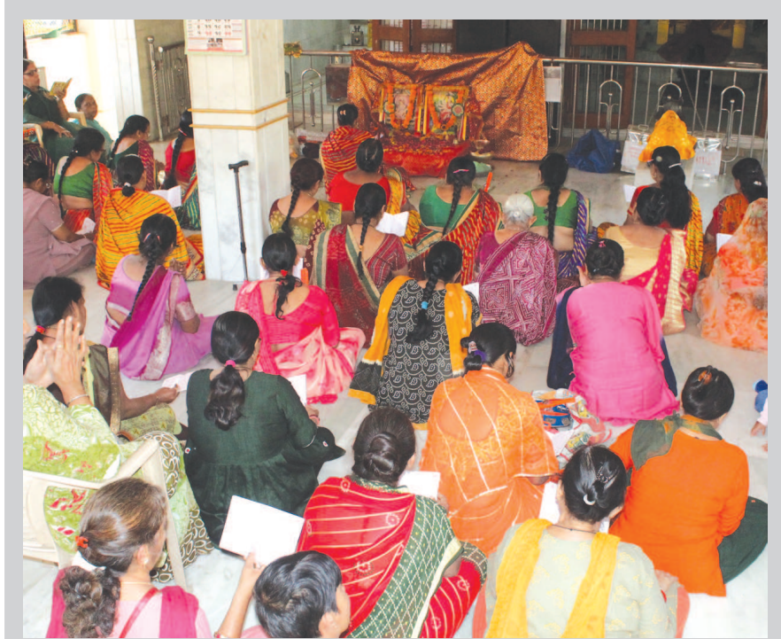
શ્રી શિવશક્તિ મંદિર, સેક્ટર-૫ એ ખાતે આનંદનો ગરબો પ્રાગટ્ય દિન નિમિત્તે શ્રી રાધાકૃષ્ણ મહિલા મંડળ દ્વારા આનંદનો ગરબો યોજાયો હતો. આ અવસરે મોટી સંખ્યામાં ભાવિકો જોવા હતા.

ભેગું કરાયેલ ફંડ આર્મ ફોર્સિસના વેલ્ફેર પ્રોગ્રામ જેમાં ભારતીય આર્મી અને ભારતીય નોસેનાના ફંડ તથા સુરક્ષાદળોમાં સેવા આપી રહેલા સભ્યો માટે ઊભા કરાયેલા વિશેષ હોસ્પિટલ અને રિહેબલિટેશન સેન્ટર્સ જેઓ સેવા દરમિયાન ગંભીર ઈજાઓનો ભોગ બનેલા જવાનોને આજીવિકા માટે યોગ્ય વિકલ્પ કે વ્યવસ્થા કરી આપે છે. અમદાવાદ મેરેથોન દ્વારા Bha અને ફિટનેસ એક્સપોનું તા. ૨૫ અને ૨૬ નવેમ્બર ખાતે આયોજન કરવામાં આવ્યું છે. જેમાં એક જ સ્થળે મોટા સ્તરે શ્રેષ્ઠ ફિટનેસ ધ્રાન્ડ જોવા મળશે.