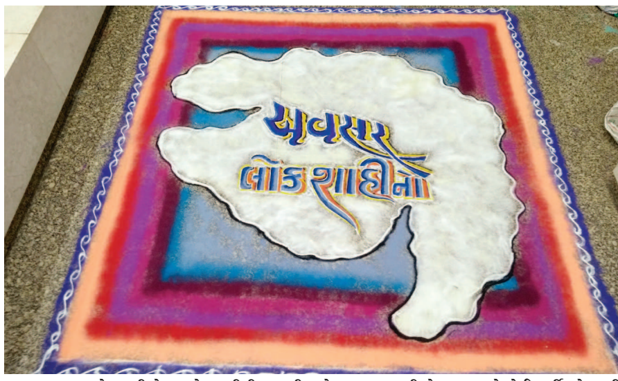
અવસર લોકશાહીનો... લોકશાહીની બહાલી માટે મતદાન જરૂરી છે. સત્તા ભલે કોઈ પાર્ટી ભોગવતી હોય પરંતુ તેમને તે સ્થાન સુધી મતદારો જ પહોંચાડે છે. સાચી લોકશાહીના સ્થાપક સામાન્ય મતદારો જ છે. કોને ગાદીએ બેસાડવા અને કોની ગાદી છીનવી લેવી તે જનતા જ નક્કી કરે છે. લોકશાહીના આ મહાપર્વમાં સામાન્ય મતદારો ઉત્સાહથી જોડાય તે માટે યૂંટણી આયોગ દ્વારા પ્રચારકાર્યને તેજ બનાવવાયું છે. સ્વર્ણિમ સંકુલ ખાતે અવસર લોકશાહીનો રંગોળી બનાવી મતદારોને મોટી સંખ્યામાં મતદાન કરવા અપીલ કરાઈ હતી.

ગાંધીનગર, તા. ૨૫ ગાંધીનગર જિલ્લાની પાંચ વિધાનસભા બેઠકના ૫૦ ઉમેદવારો પૈકી આજે ૧૩ ઉમેદવારો દ્વારા હિસાબ રજુ કરવામાં ના આવતાં તેમને તંત્ર તરફથી નોટીસ આપવાની કાર્યવાહી હાથ ધરવામાં આવી છે. જિલ્લામાં જે ૧૩ ઉમેદવારોએ હિસાબ રજુ કર્યા નથી તેમાં ૧૨ અપક્ષ ઉમેદવારોનો સમાવેશ થાય છે જ્યારે એક રાજકીય પક્ષના ઉમેદવારનો સમાવેશ થાય છે. ગાંધીનગર જિલ્લામાં વિધાનસભાની પાંચ બેઠકો માટે ૫૦ ઉમેદવારો મેદાનમાં રહ્યા હતા અને તેમને હિસાબો મતદાનના દિવસ પહેલાં ત્રણ વખત આ હિસાબો રજુ કરવાના છે. શુક્રવારે પ્રથમ તબક્કાનો હિસાબ રજુ કરવાનો હતો. મળતી વિગતો પ્રમાણે ગાંધીનગર (૬) અને (૬)ની બેઠક પર ત્રણ-ત્રણ અપક્ષ ઉમેદવારો માણસાની બેઠક પર બે અપક્ષ અને એક રાજકીય પક્ષના ઉમેદવાર દ્વારા, કલોલ અને દહેગામમાં બે-બે અપક્ષ ઉમેદવાર દ્વારા હિસાબો રજુ કરવામાં આવ્યા ન હતા. આજે સવારે ૧૦ વાગ્યાથી ગાંધીનગર જિલ્લા