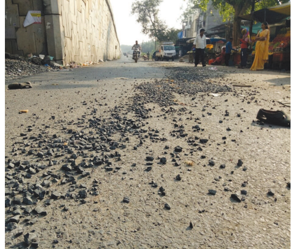
માર્ગ પર કપચી ભરેલા ડમ્પરો છેલ્લા કેટલાક સમયથી બેફમ બનતા નાના વાહન ચાલકો માટે રસ્તા પર ફેકાતા દિવ્યકીય વાહનોને અકસ્માત નડવાની શક્યતાઓ વધી જવા પામી છે.

ગાંભોઈ, તા. ૨૬ જોખમી બન્યા છે. માર્ગ પર ગાંભોઈ થી રણાસણ જતા પુરપાટ દોડતા ડમ્પરોમાંથી કપચી