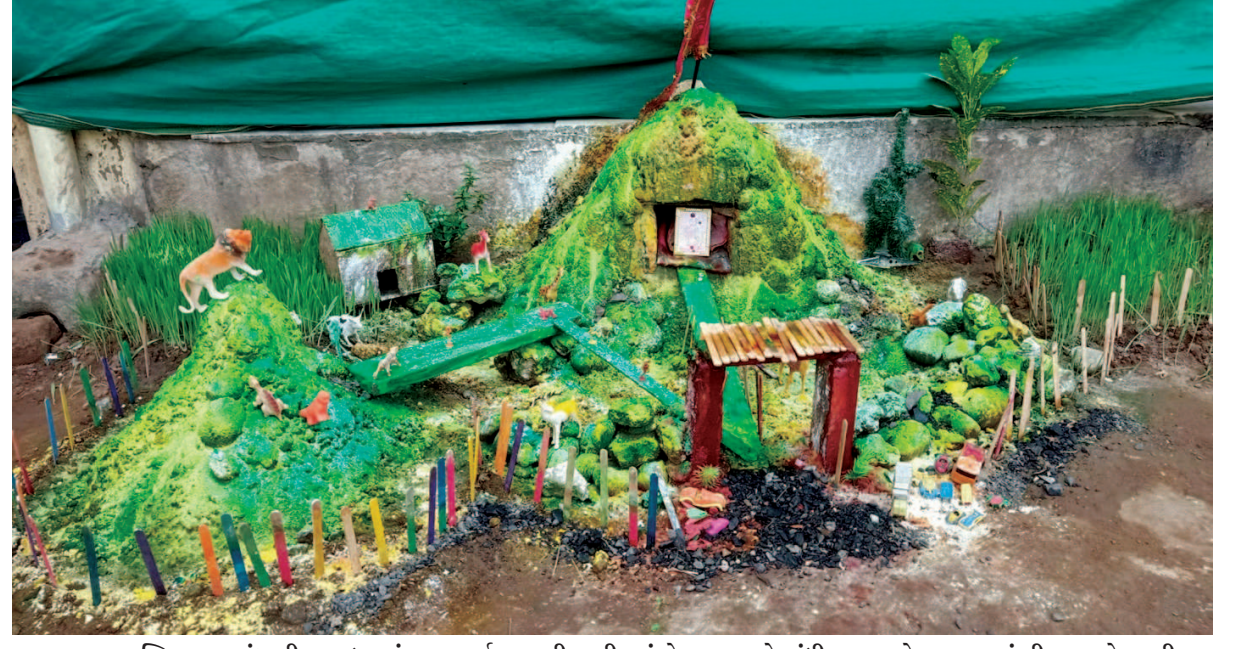
આદ્યશક્તિ મા જગદંબાની આરાધનાનું પાવન પર્વ નવરાત્રી ચાલી રહ્યું છે. આ સમયે ગાંધીનગરના સેક્ટર-૨૪માં શ્રીનગર સોસાયટીના સનેડો નવરાત્રી ગુપ્તના ૧૦૭થી ૧૫ વર્ષના બાળકો દ્વારા દર વર્ષની જેમ ગબ્બર બનાવીને પોતાની આસ્થા અને ભક્તિની પ્રદર્શિત કરી રહ્યાં છે. અને ઉલ્લેખનીય છે કે નવરાત્રીમાં ગબ્બર બનાવવાની પ્રવૃત્તિ બાળકોમાં સર્જનાત્મકતા સાથે ધાર્મિકતાના પાઠ શીખવતી પાઠશાળા સમાન હોય છે.

નિદાન તેમજ સારવાર પુરી પાડવામાં આવશે. તે ઉપરાંત બન્સ વિભાગમાં પ્લાસ્ટિક રિકન્સ્ટ્રક્ચરલ સર્જરી જેવી ઉચ્ચ કક્ષાની સુવિધા આપવામાં આવશે. રેન બસેરામાં હોસ્પિટલમાં દાખલ કરેલા તમામ દર્દીઓના સગાઓ માટે રહેવા તથા જમવાની પુરતી સગવડ માટેનું સેન્ટર ઉભુ કરવામાં આવશે. આ હોસ્પિટલ વેન્ટીલેટેડ, નેચરલ ક્યુબીક, પુરતા પ્રમાણમાં નેચરલ લાઈટીંગ વાળી બનાવવામાં આવનાર છે.