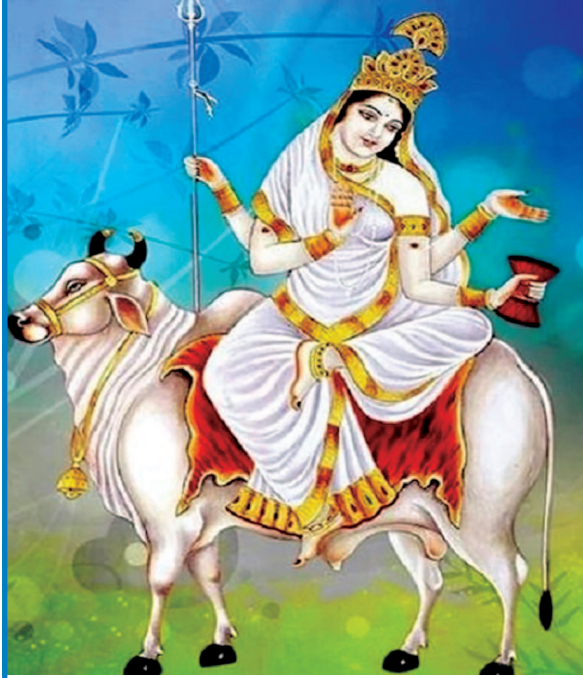
ગાંધીનગર, તા.૨ તારીખ ૩ ને સોમવારે નવરાત્રિનો આઠમો દિવસ અર્થાત આઠમું નોરતું છે. આ

દિવસે મા જગદંબાએ મહાગૌરી સ્વરૂપ ધારણ કર્યું હતું. “મા” શબ્દ જ એવો છે કે તેને બોલતાં જ માં ભરાઈ