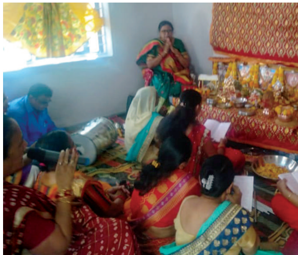
માં મેલડી આનંદ ગરબા મંડળ દ્વારા આનંદ નો ગરબો યોજાયો હતો જેમાં મોટી સંખ્યામાં ભાવિક ભક્તો ઉપસ્થિત રહ્યા હતા.

વેદ ઈન્ટરનેશનલ સ્કૂલ, સરગાસણમાં સૌપ્રથમ માતાજીની પૂજા તથા દીપ પ્રાગટ્ય કરી કાર્યક્રમની શરૂઆત કરવામાં આવી હતી. શાળાનું પટાંગણ રંગોળીથી સજાવવામાં આવ્યું હતું. ત્યારબાદ શાળા પરિવારના દરેક બાળકો તેમના વાલીઓ તથા ફેકલ્ટીઝ એ ટ્રેડિશનલ પરિધાનમાં સફર થઈ ગરબાની રમઝટ બોલાવી હતી. પધારેલ સર્વે દ્વારા મહાઆરતી કરવામાં આવી હતી. આ કાર્યક્રમમાં જિલ્લા શિક્ષણાધિકારી ભરતભાઈ વાઢેર ઉપસ્થિત રહ્યા હતા. નિર્ણાયકોએ ખૂબ જ ઝીણવટ ભર્યું નિરીક્ષણ કરી સૌથી શ્રેષ્ઠ ગરબા રમનાર વિદ્યાર્થીઓને પ્રથમ દિતીય અને તૃતીય ક્રમાંક ફાળવવામાં આવ્યા હતા. સમગ્ર કાર્યક્રમને સફળ બનાવવા શાળા પરિવારે ભારે જહેમત ઉઠાવી અને કાર્યક્રમને સફળતા પૂર્વક સંપન્ન કર્યો હતો.