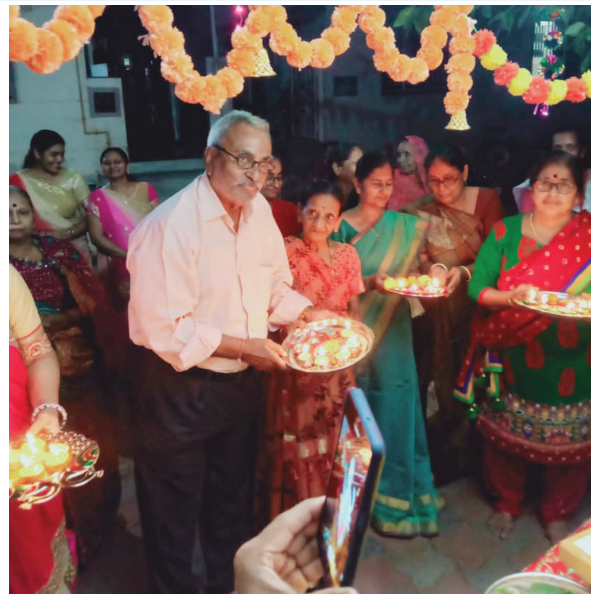
સેક્ટર-૬/બી ગરબી ચોકમાં ભાવિક ભક્તો દ્વારા નવરાત્રી પર્વની ઉજવણી કરવામાં આવી રહી છે.