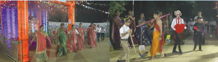
પ્રાંતિજ ખાતે કચ્છ કડવા પાટીદાર સમાજ દ્વારા નવરાત્રી દરમ્યાન વેશભુષા કાર્યક્રમ યોજાયો હતો. પોલીસ,સૈનિક, જોડર, શ્રવણ, મરાઠી, સૈનિક નેતા સહિત ની ઝાંખી જોવા મળી હતી આબેહૂબ વેશભુષા સાથે ખેલવા ઓ ગરબે ધૂમતા નજરે પડયા હતા.

બ્રહ્માણી મંડળ દ્વારા દર વર્ષની જેમ આ વર્ષે પણ સુંદર એવી વ્યવસ્થા કરવામાં આવી છે મંદિર તરફથી કોઈ પણ જાતની માર્હ ભક્તોને કચ્છના પરે તેની ઝીણવટ ભરી દેખરેખ રાખવામાં આવી છે ભક્તો દ્વારા પલ્લી માં મંગેલ બાધા પૂર્ણ કરવા માટે થી ચડાવવા માટે મંદિર માં મંદિર વ્યવસ્થા સ્થાપકો દ્વારા વ્યવસ્થા કરવામાં આવેલ છે. જયારે આધશકિત પાર્વતીના નવ અવતારોમાં દ્વિતીયમ બ્રહ્મચારીશ્રી મ્ એ બ્રહ્માની શકિતથી ઉત્પન્ન થયેલ બ્રહ્મચારીશ્રી એજ બ્રહ્માણી રૂપે સર્વત્ર પૂજવા લાગ્યાં અને અસુરો ના સંહાર વખતે બ્રહ્માણીએ પોતાના કમંડળમાં રહેલ જળનો છંટકાવ કરીને અસુરોને શકિતહીન બનાવી દીધા હતાં જયારે નર્મદા નદીના ચાણોદથી લઈને સાબરમતીના ઉત્તર ભાગને નેમેષારણ્ય તરીકે ઓળખવામાં આવતું હતું જેથી પાંડવોએ અજ્ઞાત વાસ દરમ્યાન શશ્વો આ ધાઢ જંગલોમાં ખીજડાનાઝાડ ઉપર સંતાડયાં