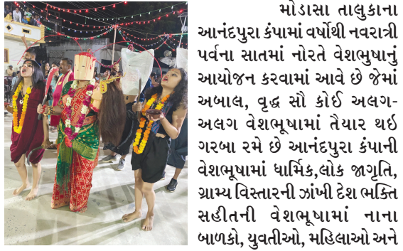
મોડાસા તાલુકાના આનંદપુરા કંપામાં વર્ષોથી નવરાત્રી પર્વના સાતમાં નોરતે વેશભૂષાનું આયોજન કરવામાં આવે છે જેમાં અબાલ, વૃદ્ધ સો કોઈ અલગ-અલગ વેશભૂષામાં તૈયાર થઈ ગરબા રમે છે આનંદપુરા કંપાની વેશભૂષામાં ધાર્મિક, લોક જાગૃતિ, ગ્રામ્ય વિસ્તારની ઝાંખી દેશ ભક્તિ સહીતની વેશભૂષામાં નાના બાળકો, યુવતીઓ, મહિલાઓ અને વૃદ્ધો આકર્ષણ જમાવે છે જેમાં ફૂલ જોગણીમાંની વેશભૂષાની લોકોએ સરાહના કરી હતી.