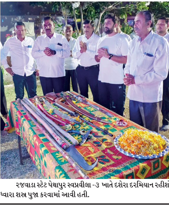
રજવાડા સ્ટેટ પેશાપુર સ્વપ્રવીણા-૩ ખાતે દર્શના દરમિયાન રહીશો ધ્યારા શસ્ત્ર પુજા કરવામાં આવી હતી.