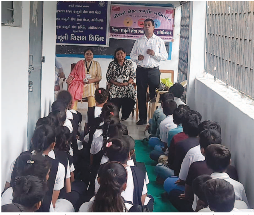
ડૉ. વિક્રમ સારાભાઈ વિદ્યાલય, પાલજ ખાતે જિલ્લા કાનૂની શિક્ષણ શિબિર યોજાઈ હતી. જેમાં મોટી સંખ્યામાં ગ્રામજનો ઉપસ્થિત રહ્યા હતા.