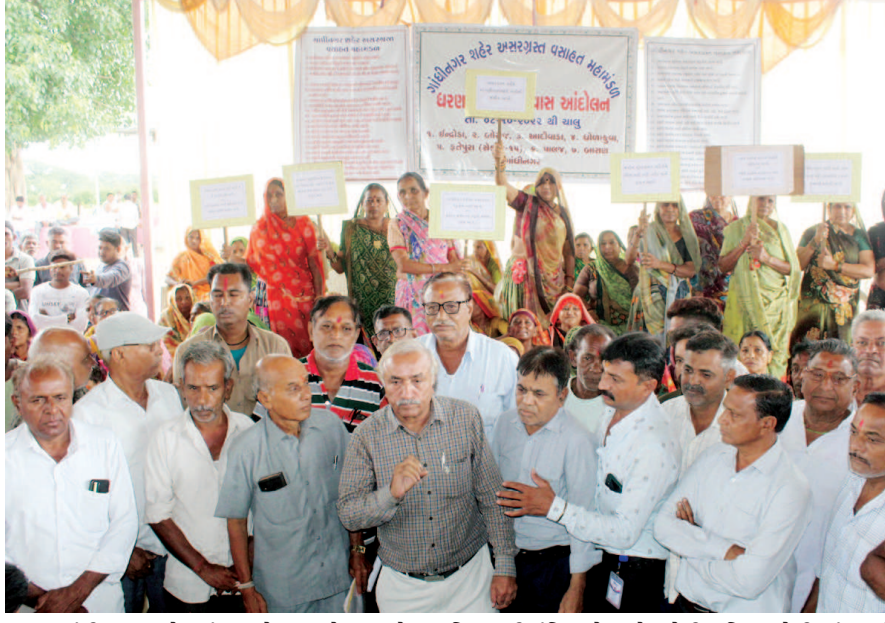
ગાંધીનગર શહેરમાં સમાવેશ કરાયેલ ગામો હજુ વિકાસથી વંચિત છે. શહેર જેવી સુવિધાઓની માંગ કરી રહેલા ગ્રામ્ય વિસ્તારો ઈન્ડોડા, બોરીજ, આદીવાડા, ધોળાકૂવા, ફતેપુરા, પાલજ અને ભાસણના ગ્રામજનોએ પોતાની પડતર માંગણીઓને લઈને પ્રતીક ઉપવાસ અને ધરણા કાર્યક્રમ યોજ્યો હતો. મોટી સંખ્યામાં ગ્રામજનો આ ધરણા કાર્યક્રમમાં જોડાયા હતા.