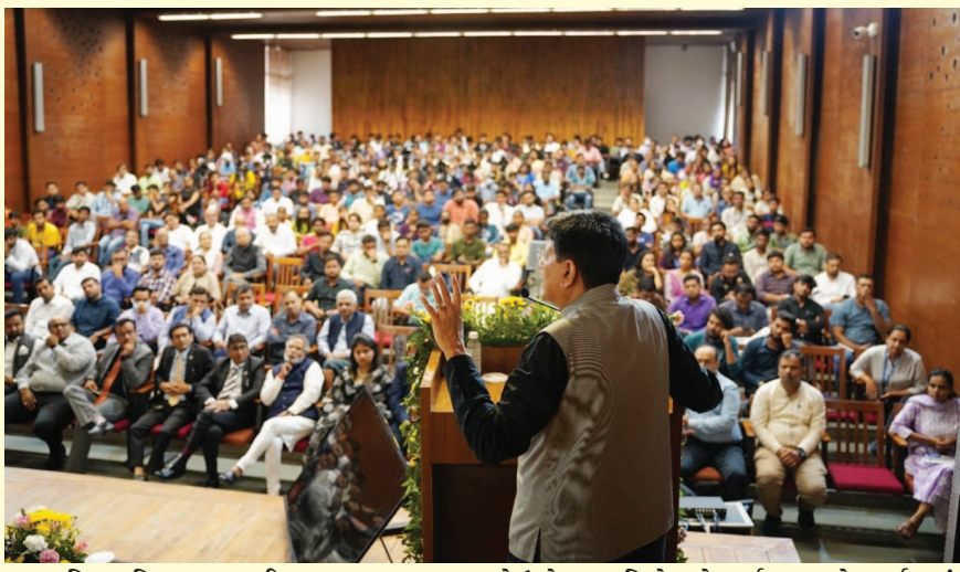
શિક્ષણ વિભાગના આઈ-હબ દ્વારા અમદાવાદ ખાતે ઉદ્યોગ સાહસિકો સાથે વાર્તાલાપના એક કાર્યક્રમનું આયોજન કરવામાં આવ્યું હતું. આ કાર્યક્રમમાં કેન્દ્રીય મંત્રી પીયુષ ગોયલે સ્ટાર્ટઅપ ઉદ્યોગ સાહસિકો અને વિદ્યાર્થીઓ સાથે વાર્તાલાપ કર્યો હતો અને તેમને માર્ગદર્શન આપ્યું હતું.