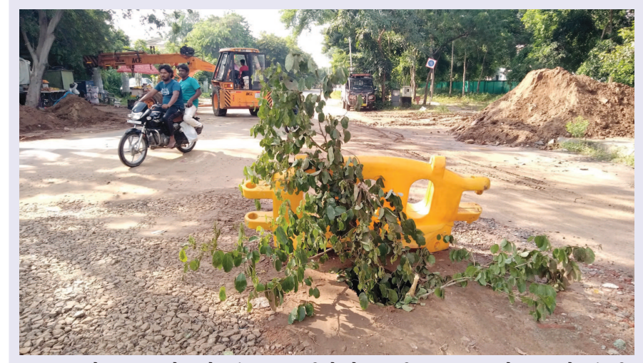
વધુ એક વખત ભૂલા - શહેરમાં ભૂલા હજુ પીછો છોડતા નથી... વરસાદ પડ્યો, ના પડ્યો ત્યાં ફરી વખત ભૂલા પડવાના શરૂ થયા છે... શહેરના રાજમાર્ગથી સેક્ટર-૭માં જવાના કટ પર સતત બીજી વખત ભૂલા પડતાં વાહકો અને વસાહતીઓ હાલાકી ભોગવી રહ્યા છે... આ ચોમાસામાં ગાંધીનગરે ખાડા રાજનો ખૂબ અનુભવ લીધો છે... શહેરનો એકપણ માર્ગ એવો નહિ હોય કે જ્યાં ભૂલા ન પડ્યો હોય...

ધરમ વધારો થયો છે. કોરોના અને સ્વાઈનફ્લુના વધતા જતા કેસો વચ્ચે ડેન્જ્યુ અને અન્ય વાહકજન્ય રોગો તેમજ વાઈરલ ફિવરના કેસો વધી રહ્યા છે એટલે તંત્ર કયો મોરચો સંભાળી રહ્યું છે તે જ ખબર પડતી નથી. ડેન્જ્યુ અને વાહકજન્ય રોગચાળા માટે શહેરમાં ૧૦૦થી વધુ ટીમો સર્વેક્ષણ કામગીરી કરી રહી છે. શહેરમાં છેલ્લા બે દિવસમાં જે વરસાદી વાતાવરણ જામ્યું છે તેને પગલે મચ્છરોની ઉત્પત્તિ માટે વધુ સાનુકૂળ પરિસ્થિતિ ઉભી થઈ હોવાથી તંત્રની દોડધામ વધી જવા પામી છે. વરસાદી પાણીના નિકાલની યોગ્ય વ્યવસ્થાના અભાવે પાણી ભરાઈ રહેવાની ફરિયાદો પણ ઉઠી છે. વાતાવરણમાં આવેલા પદ્ધતિને પગલે આ કેસો આગામી દિવસોમાં વધે તેવા પુરેપુરા સંકેતો વચ્ચે તંત્રએ એન્ટી લારવેલ અને માસ ફોર્ગીંગ સહિતની કામગીરીને સઘન બનાવવાની રણનીતિ તૈયાર કરી છે. મળતી વિગતો પ્રમાણે ડેન્જ્યુ ઉપરાંત મેલેરિયા તેમજ ચિકનગુનિયાના કેસોએ જે દેખા દીધી છે તે ચિંતાજનક છે. મેલેરિયાના કેસોમાં અગાઉની સરખામણીમાં ઘટાડો જોવા મળ્યો છે. જો કે ઝેરી મેલેરિયાના છુટા છવાયા કેસો મળતાં તંત્ર સતત દોડધામ કરતુ જણાયું છે. કન્સ્ટ્રક્શન સાઈટો પર મજૂરોના સ્કીનીંગની કામગીરીને પણ