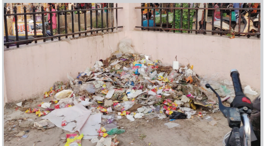
સેક્ટર ૨૧ માર્કેટ તાજેતરમાં કચરા માર્કેટમાં ફેરવાઈ ગયું છે. સાફ સફાઈનો અભાવે ટેર ઠેર ગંદકીથી માર્કેટ ખદબદી રહ્યું છે. માર્કેટમાં કચરાના ઢગલા દ્રશ્યમાન થઈ રહ્યા છે. ત્યારે સ્વચ્છતા સર્વેક્ષણમાં પાટનગરનો ક્રમાંક ગત વર્ષની સરખામણીએ ઘણો નીચે ઉતર્યો છે જેના માટે પણ આવા કચરાના ઢગ કારણભૂત માની શકાય..