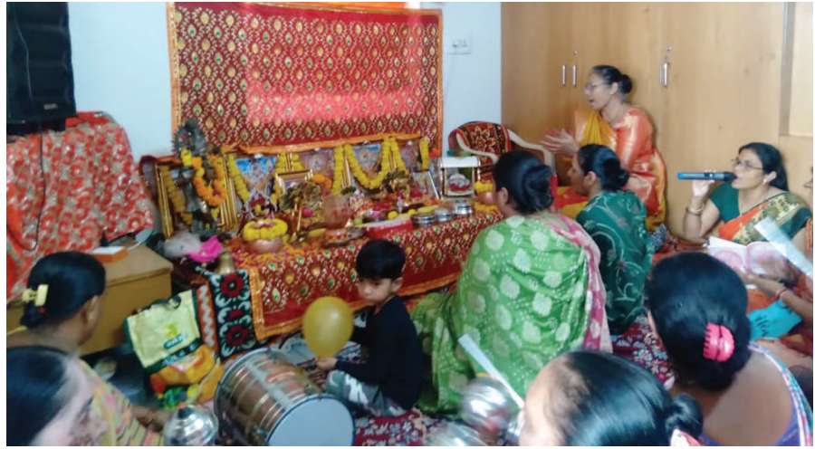
માં મેલડી આનંદ ગરબા મંડળ દ્વારા આનંદનો ગરબો યોજાયો હતો. જેમાં મોટી સંખ્યામાં ભાવિક ભક્તો ઉપસ્થિત રહ્યા હતા.

લોકોનું લૂંટ્યું છે તે તેમને દેશને પાછું આપવું જ પડશે. વડાપ્રધાન મોદીએ જણાવ્યું હતું કે, 'મારા ગુજરાત અને ભારત સરકારમાં કામની શરૂઆત નવો નવો વિસ્તાર કરતા જાય છે. તેની પાછળ માત્ર સરકાર નહીં માત્ર નરેન્દ્ર-ભૂપેન્દ્ર નહીં પરંતુ તમારા જેવા સાથીઓની દિવસરાતની મહેનતના કારણે આ શક્ય