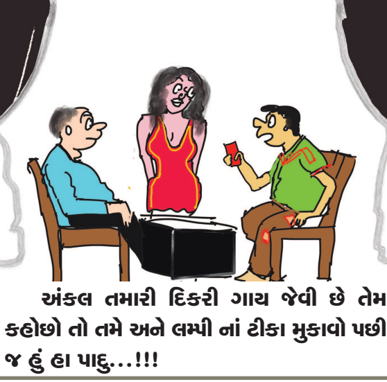
અંકલ તમારી દિકરી ગાય જેવી છે તેમ કહો છો તો તમે અને લમ્બી નાં ટીકા મુકાવો પછી જ હું હા પાડું...!!!