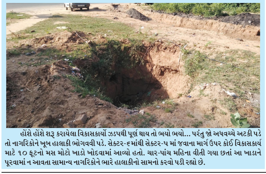
હોશ હોશ શરૂ કરાયેલા વિકાસકાર્યો ઝડપથી પૂર્ણ થાય તો ભયો ભયો... પરંતુ જો અધવચ્ચે અટકી પડે તો નાગરિકોને ખૂબ હાલાકી ભોગવવી પડે. સેક્ટર-૬ માંથી સેક્ટર-૫ માં જવાના માર્ગ ઉપર કોઈ વિકાસકાર્ય માટે ૧૦ ફૂટનો મસ મોટો ખાડો ખોદવામાં આવ્યો હતો. ચાર-પાંચ મહિના વીતી ગયા છતાં આ ખાડાને પૂરવામાં ન આવતા સામાન્ય નાગરિકોને ભારે હાલાકીનો સામનો કરવો પડી રહ્યો છે.