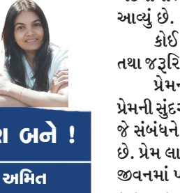
એમ પણ બને! પાણ અમિત

જે દિવસે વ્યક્તિની ઓળખમાં સુંદરતા ને નજર અંદાજ કરવામાં આવશે ત્યારે પ્રેમની ખરી વ્યાખ્યા સર્જાશે. ત્યાં સુધી બધું મિથ્યા, દરેક ને પ્રેમ સુંદરતા સાથે જ જોઈએ છે. ભલે એ પ્રેમ ટકાઈ હોય કે ના હોય. પ્રેમ કરવો સહેલો છે. પરંતુ પ્રેમને સમજવો એટલો જ મુશ્કેલ છે. હું માનું છું ત્યાં સુધી મુશ્કેલ વસ્તુ પ્રેમ હોઈ જ ના શકે? જ્યાં સરળ હોય બધું જ એકમય હોય એ જ પ્રેમ. પણ પ્રેમ પાછો ત્યાં જ ટકે જ્યાં આપણી લાગણીને સમજનાર અને આપણી ખામીઓને સંવેદીકારનાર હોય, બાકી પ્રેમ સાઈડ માં રહી જાય અને રિસામણે જતી વ્યક્તિ બીજી સાઈડે. ગમતું પાત્ર ગમતું બધું કરવા દે એટલે પ્રેમનું ઊભરું ઉભરાઈ આવે, અને સહેજ કંઈક આડું અવળું મરજી વિરુદ્ધ થયું, કેમ? શું કામ? આમ કેમ જેવું આધિપત્ય આવી જાય એટલે એ જ ઊભરું સમી જાય અને એમાં ગાબડું પડી જાય. વિશ્વમાં જો સૌથી ટૂંકી આવરદા હોય તો પ્રેમ ની..