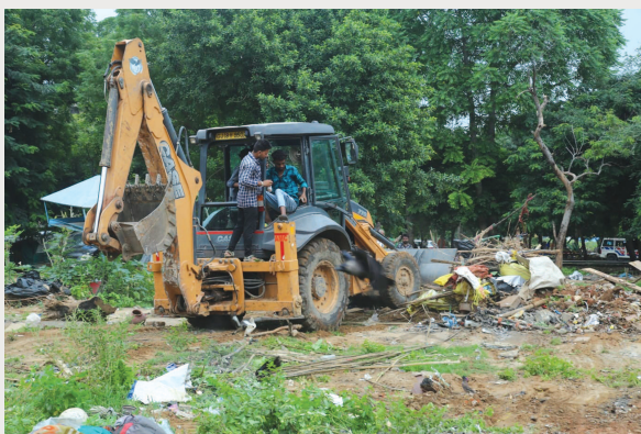
મહાનગરપાલિકા દ્વારા સંયુક્ત ચુબેશ હાથ ધરી તમામ દબાણો દૂર કરાયા તે માટે સેક્ટર-૬

અને ઉમેર્યું હતું કે હવે સે-પ વસાહતનીઓને અડચણરૂપ થશે તો સરકારમાં રજૂઆત કરવામાં આવશે તેવી ચીમકી ઉચ્ચારી હતી. તંત્ર દ્વારા આ દબાણો અંગે પુનઃચુબેશ કરી એના અંજ કામ વારંવાર કરી પ્રજાના પૈસાનો ધુમાડો કરવામાં આવે તેના કરતાં કાયમી ઉકેલ લાવવામાં આવે તેવી ગાંધીનગર શહેરના નાગરિકોની માંગણી છે. સેક્ટર-પ/ડી અને સેક્ટર-૬માંથી રહેણાંક વિસ્તારમાં આવેલા મુંડપટ્ટી તથા અન્ય ઉભા થયેલા તમામ દબાણો હટાવવા માટે માર્ગ મકાન વિભાગ, વનવિભાગ,