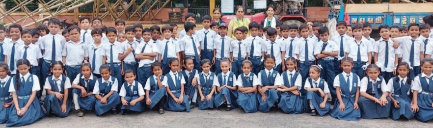
ગાંધીનગર, તા.૨ શ્રીમતી આર. એન પટેલ પ્રાથમિક શાળામાંથી સહઅભ્યાસિક શૈક્ષણિક પ્રવૃત્તિના ભાગરૂપે ધોરણ-૩ના ૧૦૫ વિદ્યાર્થીઓ અને ચાર શિક્ષકોએ ઈન્ડોડા પાર્કની મુલાકાત લીધી હતી. ઈન્ડોડા પાર્ક ના અધિકારી દ્વારા વિદ્યાર્થીઓને પ્રાણી-પક્ષીની સ્વચ્છતા અને જાળવણીનું માર્ગદર્શન આપવામાં આવ્યું હતું. બાળકોએ ડાયનાસોરના જીવાવશેષ કુતુહલતાપૂર્વક નિહાળ્યા હતા. ત્યારબાદ બાળકોને સરિતા ઉદ્યાનમાં લઈ ગયા ત્યાં ચાર દીવાલોની બહાર કુદરતી વાતાવરણનો આનંદ મળ્યો તેમજ જુદી જુદી રાઈડ્સ અને રમતોના સાધનોની મજા માણી હતી. આ મુલાકાતથી વિદ્યાર્થીઓને પ્રકૃતિ પ્રેમ અને પર્વાવરણની જાળવણી તથા સ્વચ્છતા લાભી બની શકે છે.