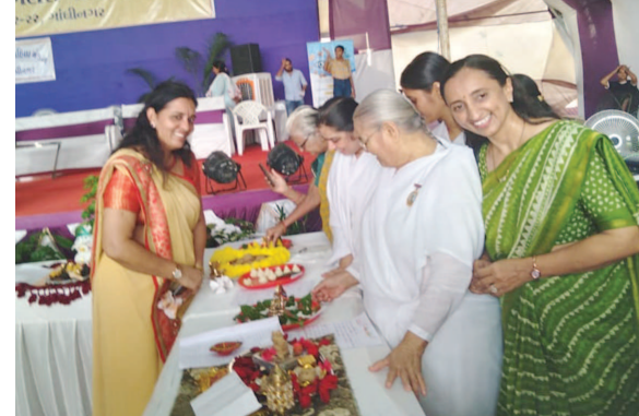
જ્યોતિ મહિલા મંડળ ગાંધીનગર દ્વારા સાર્વજનિક ગણેશ ઉત્સવ સમિતિના સહયોગથી હકદી કુંકુ અને વિવિધ કાર્યક્રમો યોજાયા હતા.