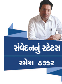
સંવેદનનું સ્ટેટસ રમેશ ૬૬૬૨

સાધના કહે છે.." એક નિબંધનું શિર્ષક છે "મને મારી પોતાની બીક લાગે છે..!" એમાં "જગત જો સંતોનું જ બનેલું હોય તો એમાં જીવવાનો કોને રસ પડે ? આ દુનિયા મારા તમારા જેવા જાત સાથે બાહોડિયાં ભરતા એકાદ ડગલું આગળ વધતા, બે ડગલાં પાછળ જતા અને ફરી પાછા બાંધો ચડાવીને આગળ ચાલવા માંડતા નિબંધ માણસોની વિશે ટકોર કરી છે.. 'તાણનું સંગીત' કાવ્યાત્મક છે.. સૌથી મસ્ત નિબંધ એ 'મનની ઉઘાડી બારી' છે.. અંગ્રેજી શબ્દ લિબરલ સ્પિરિટ માટે એમણે આવા ભાવાનુવાદ કર્યો છે.. ધર્મ એટલે એમણે પંડિત સુખલાલજીની વ્યાખ્યા મુકી છે.. 'ધર્મ એટલે સત્યની તાલાલીની અને વિવેકી સમભાવ.. તેમજ એ બે વિવેકી તત્વોની વચ્ચે ઘડાતો જીવનવ્યવહાર.." "મોંઘી સાદગી" અને "લાઈબ્રેરીમાં" મૌલિક વિષયની આગવી રજૂઆત છે.. લેખકને ગમતો વિષય દરિયો છે.. અને એટલે જ એક નિબંધનું શિર્ષક "દરિયાકિનારે" છે.. ગુજરાતી સાહિત્યમાં 'પસંદબંધ' એટલે કે અંગત નિબંધો બહુ ઓછા લખાયા છે.. વાડીલાલ ડગલીનો આ સંગ્રહ એમાં મોટી ઉપલબ્ધિ છે..