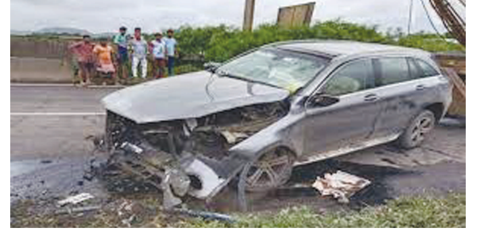
અનુસંધાન પાન-૭ પર

કારોબાર શાપૂરજી પેલોનજી ગ્રુપમાં કામ કરવાનું શરૂ કર્યું હતું. સાયરસ માત્ર ૩ વર્ષમાં જ ૧૯૮૪માં શાપૂરજી પલોનજી ગ્રુપના ડાયરેક્ટર બન્યા હતા. તેમણે પિતાની જેમ ભારતમાં અનેક મોટા રેકોર્ડ બનાવ્યા, જેમાં સૌથી ઊંચા રહેણાંક ટાવર, સૌથી લાંબા રેલવે પુલનું નિર્માણ અને સૌથી મોટા બંદરનું નિર્માણ સામેલ છે. પલોનજી ગ્રુપનો કારોબાર કપડાથી લઈ રિયલ એસ્ટેટ, હોસ્પિટલિટી અને બિઝનેસ ઓટોમેશન સુધી