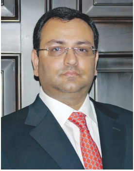
સાયરસ મિસ્ત્રી, તા.૪ જાણિતા ઉદ્યોગપતિ અને બિઝનેસમેન સાયરસ મિસ્ત્રીનું

સાયરસ મિસ્ત્રી આઈરીશ ઈન્ડિયન ઉદ્યોગપતિ હતા અને તેઓ તાતા ગ્રુપમાં ચેરમેન પદે પણ કામ કરી ચુક્યા છે