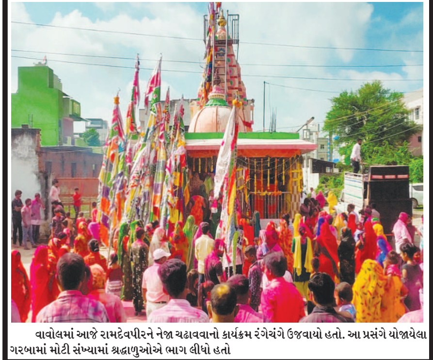
વાવોલમાં આજે રામદેવપીરને નેજા ચઢાવવાનો કાર્યક્રમ રંગેરંગે ઉજવાયો હતો. આ પ્રસંગે યોજાયેલા ગરબામાં મોટી સંખ્યામાં શ્રદ્ધાળુઓએ ભાગ લીધો હતો