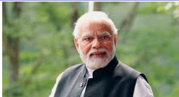
પર્યાવરણ સંવર્ધન માટે સતત સક્રિય છે, આપણે સૌ જાણીએ છીએ કે આપણે જેટલા વધુ વૃક્ષો વાવીશું, જેટલું પર્યાવરણનું જતન કરીશું તેટલું ઝડપથી આપણે કલાયમેટ ચેન્જની અસરોમાંથી બહાર આવી શકીશું. મુખ્યમંત્રીશ્રી ભૂપેન્દ્રભાઈ પટેલના નેતૃત્વમાં ડબલ એન્જિન સરકાર રાજ્યમાં પર્યાવરણના સંરક્ષણ માટે પગલાં લઈ રહી છે. છોડમાં રણછોડ અને પ્રાણીમાં પરમેશ્વર જોવાની પ્રકૃતિ ધરાવતા મુખ્યમંત્રીશ્રી ભૂપેન્દ્રભાઈ પટેલ રાજ્યમાં વૃક્ષોનું વાવેતર અને વન્ય જીવોના સંરક્ષણ સતત જાગૃત છે, તાજેતરમાં તેમના નેતૃત્વ હેઠળ રાજ્યના ૭૩મો વન મહોત્સવની ઉજવણી થઈ..

આપણે સૌ આજે બદલાતા વાતાવરણની અસરો અનુભવી રહ્યાં છીએ. ક્યારેક અતિશય ઠંડી તો ક્યારેક અતિશય ગરમી અને ક્યારેક તો અસામાન્ય વરસાદ હવે સામાન્ય બનતા જઈ રહ્યાં છે. આપણે સૌ જાણીએ છીએ કે આ બધી સમસ્યાઓના મૂળમાં ગ્લોબલ વોર્મિંગ રહેલું છે. પોતાના સ્વાર્થ માટે મનુષ્યએ પર્યાવરણને ખૂબ નુકશાન પહોંચાડ્યું છે. કલાયમેટ ચેન્જની સમસ્યા માટે તત્કાલિન મુખ્યમંત્રી અને આપણા હાલના વડાપ્રધાનશ્રી નરેન્દ્રભાઈ મોદીએ દેશમાં પહેલો કલાયમેટ ચેન્જ વિભાગ ગુજરાતમાં શરૂ કર્યો છે. આજે પણ કેન્દ્રની નરેન્દ્ર મોદી સરકારના સહયોગથી રાજ્યની ડબલ એન્જિન સરકાર પણ