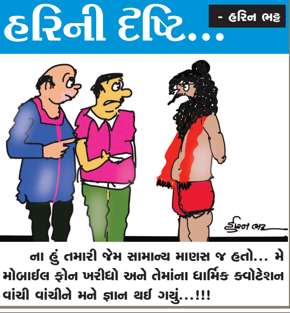
ના હું તમારી જેમ સામાન્ય માણસ જ હતો... મે મોબાઇલ ફોન ખરીદ્યો અને તેમાંના ધાર્મિક ક્વોટેશન વાંચી વાંચીને મને જ્ઞાન થઈ ગયું...!!!!