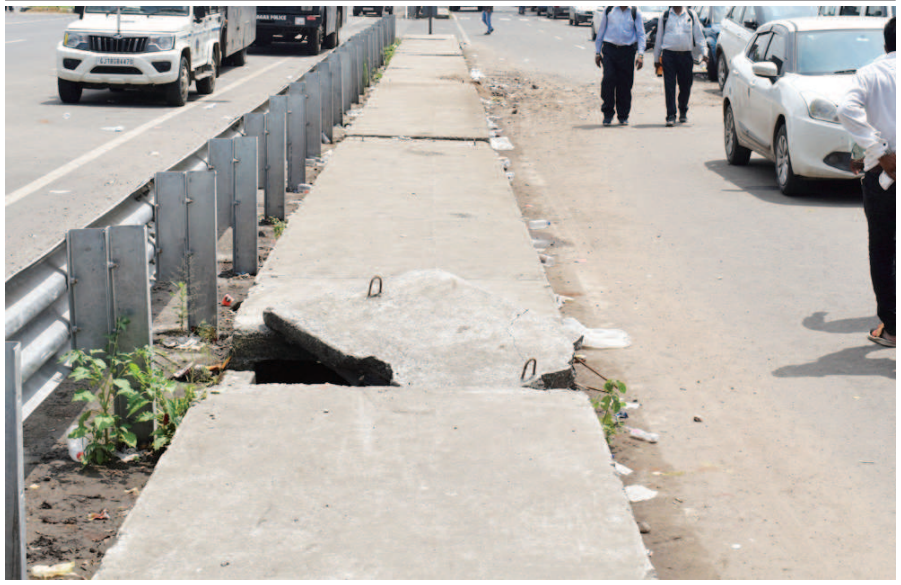
ચિલોડાથી પાલજ જવાના માર્ગે થોડા સમય પહેલા જ વરસાદી પાણીની નીકાલ માટે પાર્કિંગના નાંખવામાં આવી છે. આ પાર્કિંગના નાંખવામાં એક ઢાંકણુ તુટી ગયું છે જે વાહનચાલકો માટે જોખમરૂપ બન્યું છે.