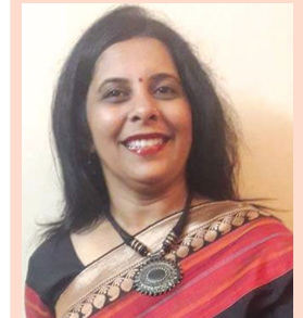
મિતલ રાજા લાયોનેસ કલબ