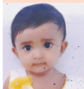
રાજ આરાધ્યા બા