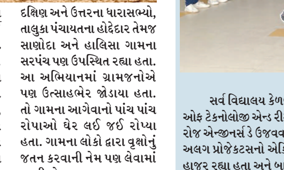
દક્ષિણ અને ઉત્તરના ધારાસભ્યો, તાલુકા પંચાયતના હોદ્દેદાર તેમજ સાણોડા અને હાલિસા ગામના સરપંચ પણ ઉપસ્થિત રહ્યા હતા. આ અભિયાનમાં ગ્રામજનોએ પણ ઉત્સાહભેર જોડાયા હતા. તો ગામના આગેવાનો પાંચ પાંચ રોપાઓ ઘેર લઈ જઈ રોપ્યા હતા. ગામના લોકો દ્વારા વૃક્ષોનું જતન કરવાની નેમ પણ લેવામાં આવી છે.

જ સાડા ચાર હજાર જેટલા વૃક્ષો રોપવામાં આવ્યા છે. ગામના સરપંચે જણાવ્યું હતું કે ગામમાં ૧૫મી ઓગષ્ટથી વૃક્ષારોપણ અભિયાન શરૂ કરવામાં આવ્યું હતું. જે ૭મી સપ્ટેમ્બર સુધી ચાલ્યું તરસુંબો તળાવ, શિવપુરા કંપાથી હાલિસા રોડ, સાણોડા રોડ, સિકોતર માતાનું મંદિર વગેરે જગ્યાએ વૃક્ષારોપણ કરવામાં આવ્યું છે. વિવિધ દિવસોએ વૃક્ષારોપણ પ્રવૃત્તિમાં ગાંધીનગર