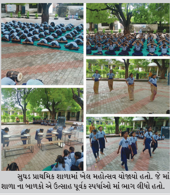
સુઘડ પ્રાથમિક શાળામાં ખેલ મહોત્સવ યોજાયો હતો. જે માં શાળા ના બાળકો એ ઉત્સાહ પૂર્વક સ્પર્ધાઓ માં ભાગ લીધો હતો.

એમણે કીધું એટલે થાળી વગાડી એમણે કીધું એટલે ઝંડા લગાડ્યા હવે, અમે કહીએ છીએ એ નથી કરતા... માટે અમારે આંદોલન કરવું પડે છે...!!!