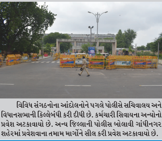
વિવિધ સંગઠનોના આંદોલનોને પગલે પોલીસ સચિવાલય અને વિધાનસભાની કિલ્લેબંધી કરી દીધી છે. કર્મચારી સિવાયના અન્યોનો પ્રવેશ અટકાવાયો છે. અન્ય જિલ્લાની પોલીસ બોલાવી ગાંધીનગર શહેરમાં પ્રવેશવાના તમામ માર્ગોને સીલ કરી પ્રવેશ અટકાવાયો છે.

ગાંધીનગર, તા. ૧૬ ગાંધીનગર શહેરના સેક્ટર-૧૬ સ્થિત બ્રહ્મ ભવન ખાતે નવરાત્રી નિમિત્તે બ્રહ્મ મહિલા ગરબા સ્પર્ધાનું આયોજન આગામી તા. ૨૮ સપ્ટેમ્બર બુધવારના રોજ બપોરે ૨ થી ૫ કલાક દરમિયાન કરવામાં આવ્યું છે. જેમાં વયજુથ ૧ થી ૫ વર્ષ, ૧ થી ૨૫ વર્ષ, ૨૬ થી ૪૦ વર્ષ, ૪૧ થી ૫૫ વર્ષ અને ૫૬ વર્ષથી વધુ વયના બ્રહ્મ મહિલા ગરબામાં ભાગ લઈ શકશે. આ ગરબા સ્પર્ધાનું આયોજન સમસ્ત બ્રહ્મસમાજ