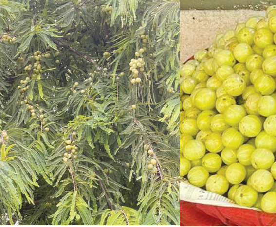
ફોસ્ફોરસ ૦.૦૨, પ્રતિશત, લોહતત્વ ૧.૨ મિ.ગ્રા., નિકોટિનિક એસિડ ૦.૨ મિ.ગ્રા. જેટલું મળી આવે છે. આ ઉપરાંત આમાં ગૈલિક એસિડ, ટૅનિક એસિડ, શર્કરા (ગ્લુકોઝ), આલબ્યુમિન, કાઈજ વગેરે તત્વ પણ જોવા મળે છે. એન્ટી ઓક્સિડેન્ટ્સનો પ્રમાણ એન્ટી ઓક્સિડેન્ટ્સ શરીરને ફી રેડિકલ્સના પ્રભાવ સામે લડવામાં મદદ આપે છે. એવું માનવામાં આવે છે કે, એન્ટી ઓક્સિડેન્ટ્સથી ભરપૂર આહાર કેટલાક પ્રકારના કેન્સર, હૃદય રોગ, ટાઈપ-૨ ડાયાબિટીસ, ઉંમર વધવાના જોખમ ઉપરાંત મસ્તિષ્કની ક્ષતિ સામે રક્ષણ આપે છે. આંબળામાં અનેક પ્રકારના પ્રભાવી એન્ટિ ઓક્સિડેન્ટ્સ હોય છે જેનું સેવન શરીર માટે

ગાંધીનગર, તા. ૧૬ ચોમાસા ની વિદાય થવા જઈ રહી છે અને ઠંડી ની મોસમ આવી રહી છે ત્યારે બજારો માં શિયાળા માં ખવાતું ઉત્તમ ફળ આંબળા નું આગમન થઈ ચૂક્યું છે. ગાંધીનગર ની આસપાસ ના ગામ માં આંબળા નાં વૃક્ષો પર લીલાછમ ગોળમટોળ આંબળા નાં જુમળા જોવા મળી રહ્યા છે જેનું વેચાણ શહેર ના બજાર માં ચાલુ થઈ ચૂક્યું છે જે કે શિયાળામાં બજારોમાં ફળો અને શાકભાજીઓનો મેળાવડો જામે છે જે સ્વાસ્થ્ય માટે પણ ખૂબ જ લાભદાયી છે. આંબળા પણ એક એવું ફળ છે જેનું ભારત સહિત વિશ્વના મોટા ભાગના દેશોમાં તેના અનેક પ્રકારના સ્વાસ્થ્ય લાભ માટે સેવન કરવામાં આવે છે. આંબળાના અચાણા, મુરબ્બા વગેરે સ્વાદમાં લાજવાબ હોય છે અને સાથે જ તેના દૈનિક સેવનથી આંખો અને ત્વચા ઉપરાંત શરીરના અન્ય અંગોને પણ ઘણો ફાયદો થાય છે. નિષ્ણાંતો ડાયાબિટીસ