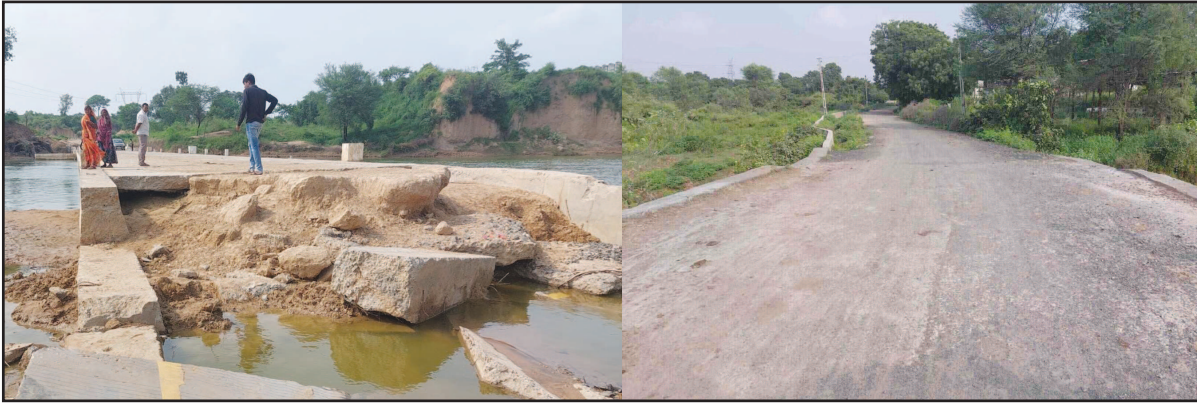
વાયદાઓ કરતી સરકારનો સમય જતા અસલી સ્વરૂપ સામે આવી રહ્યું છે. કામચલાઉ ધોરણે લોકોના મનની દીવાલો પર સરકારે મારેલા વાતોના અને વાયદાઓના રંગબેરંગી સપનાઓના રંગ ઉડી રહ્યા છે. તે નેતા, કોન્ટ્રાક્ટરોની અને અધિકારીઓની મિલીભગતના પુરાવાઓના પોપડા ઉભી રહ્યા છે.

મત પણ અંકે કરી દીધા હતા પરંતુ કહેવાય છે કે જેને માથે ખુદ સરકારનો હાથ હોય તેવા અધિકારીઓનું કોઈ કશું બગાડી શકતું નથી. તે ન્યાય નેતાઓની રહેમ નજર હેઠળ ફૂલેલા ફાલેલા જાડી ચામડીના કોન્ટ્રાક્ટરોએ આ રસ્તાઓમાં લોટ પાણી અને લાકડાની કહેવતની જેમ નક્કી થયેલ ધારા ધોરણ તથા ટેન્ડરની શરતોને કોરાણે મુકી પોતાના અને નેતાઓના ગજવા ભરવા માટે હલકી ગુણવત્તાના કામો કરી રોકડી કરી લીધી છે. જેનું પરિણામ હવે કરોડોનો ટેલ ભરનાર તેમજ પોતાના કીમતી મતોથી મત પેટીઓ ભાજપની