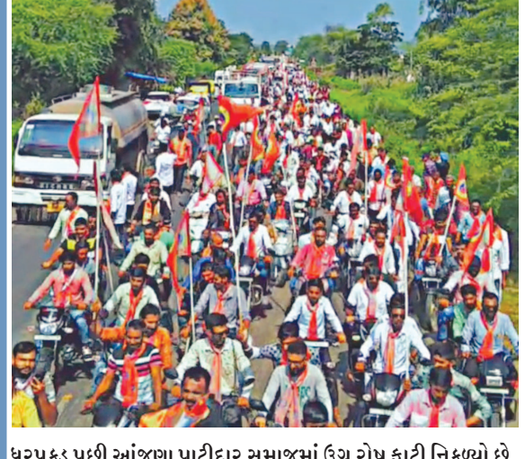
ધરપકડ પછી આંજણા પાટીદાર સમાજમાં ઉગ્ર રોષ ફાટી નિકળ્યો છે.