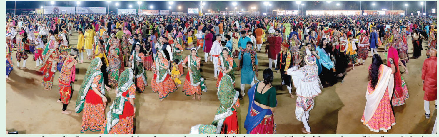
કુમ કુમ કેરા પગલે માડી... ગરબે રમવા આવો ને... પરંપરાગત અને ગુજરાતી સંસ્કૃતિની છાંટવાળા ગરબાઓની તાલે ગાંધીનગરનો મન સુકીને રુમી રહ્યા છે. બે વર્ષ બાદ આયોજીત થયેલા ગરબામાં ખેલેલાઓ મન સુકીને મહાલી રહ્યા છે અને અવનવા સ્ટેપ્સ વડે ગરબાનો આનંદ માણી રહ્યા છે. કલ્ચરલ ફોરમનું ગરબા પ્રાઉન્ડ ખેલેલાઓથી જાણે ઉભરાઈ રહ્યું છે. મોજ-મસ્તી અને આનંદ-ઉમંગથી સભર ખેલેલાઓ નવરાત્રીને વધુને વધુ ઉલ્લાસમય બનાવી રહ્યા છે. અવનવા ભાતીગળ પહેરવેશમાં સજ્જ ખેલેલાઓ સતત ત્રણ-ચાર કલાક સુધી ગરબા રમીને મા આદ્યશક્તિની અનોખી આરાધના કરવાનો લ્હાવો મેળવી રહ્યા છે. શહેરના પાર્ટીપ્લોટ્સ ઉપરાંત શેરી ગરબાઓમાં પણ ખેલેલાઓ મન સુકીને ગરબે ઘુમી રહ્યા છે.