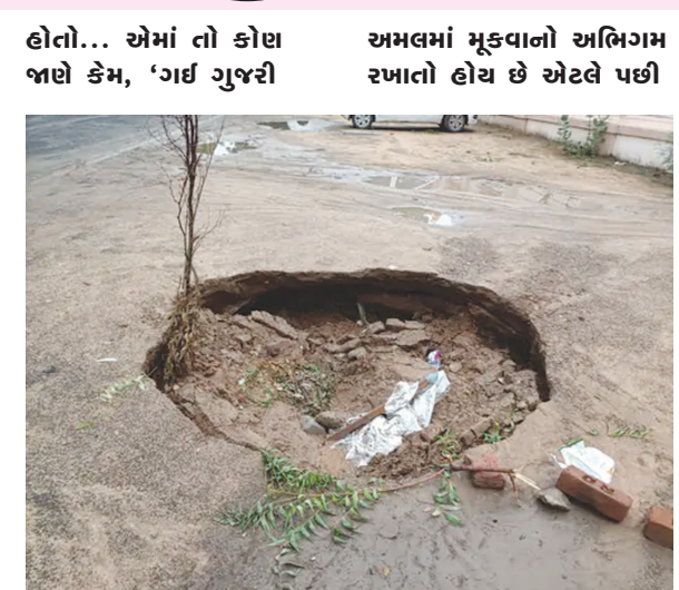
ભૂલી જાવ' કે 'ભવિષ્યનું વિચારો, ભૂતકાળમાં કરેલું ભૂલી જાવ' ની ફિલસૂફી

ખાડા જ ખાડા નક્કરે પડતા હતા ને? અને જયાં ખોદેલું નહોતું ત્યાં ય કચારે ખોદકામ - ખાડાની સપ્ટેમ ભેટમ ળી જશે એની ગેરન્ટી નહોતી !!