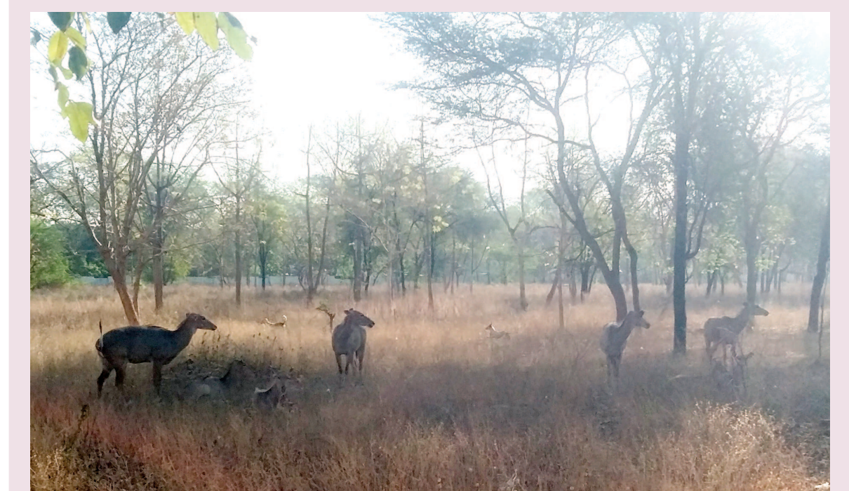
આ પણ ગાંધીનગર... - તસવીર ઈન્ડોડા ઉદ્યાનની નથી... શહેરના પૂર્ણ વિકસિત એટલે કે સેક્ટર-૫ના રહેણાંક વિસ્તારની છે... આજુબાજુની ઝાડીમાં નીલગાય કોઈપણ જાતના નિયંત્રણ વગર બેકિકર દોડાદોડી કરતી હોય છે... નગરજનોની અવરજવર દરમિયાન સતત ભય રહેતો હોય છે કે, ક્યારેક નીલગાય ઝપટમાં તો નહિ લેને... આ વાત એક સેક્ટરની નથી... શહેરના નવા સેક્ટરોમાં આવા દૃશ્યો રોજીદા બનતા જાય છે... ઈન્ડોડા ઉદ્યાન ગાંધીનગરનું ગૌરવ જરૂર છે પરંતુ નીલગાયો માનવ વસાહતમાં વ્યાપક પ્રમાણમાં ફરતી જોવા મળે છે જે ચિંતાનજક છે... અનેક વખત અલગ-અલગ સંસ્થાઓ દ્વારા રજૂઆતો કરાયા છતાં કોઈ નક્કર કાર્યવાહી થઈ નથી...