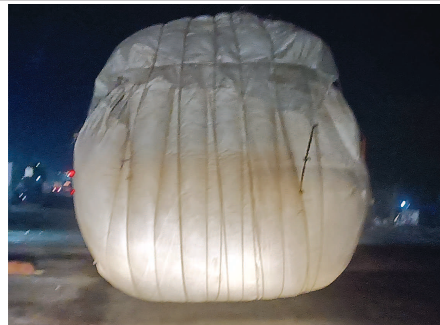
જાહેર માર્ગો પર આવા દૃશ્યો અવારનવાર રાત્રીના જ જોવા મળે ત્યારે એક સવાલ તો થાય જ કે દિવસે કેમ આવી સવારી જોવા નહિ મળતી હોય! પરંપરા માનવીને પોતાના જીવનની ચિંતા નહિ હોય? થોડાક રૂપિયા કમાવા અને થોડોક સમય બચાવવા આવી જોખમી સવારી ભારે પડી શકે છે...

લાઈન ભરવા માટે થાય છે. નભોઈ પમ્પિંગ સ્ટેશન પરથી અંદાજિત ૪૦ એમએલડી જેટલું પાણી પૂરું પાડવામાં આવે છે અને ગાંધીનગર શહેરમાં ૬૦ એમએલડીની પ્રતિદિન જરૂરિયાત છે જયારે બોરનું અને નર્મદાનું મળીને પાણીનો જથ્થો ૫૨ એમએલડી જ થતા ૮ એમએલડીની ઘટની સમસ્યા સર્જાય છે જો કે પાણીની ઘટ નિવારવા બોર પણ ઉપયોગી બને છે બોરના પાણી લેવામાં ન મળે તો ઘટ વધે છે અલબત્ત પ્રતિદિન ૨૦ એમએલ ડીની ઘટ ઉદભવે હાલ સર્જાયેલી પાણીની ઘટ આકરી ગરમીના ટાણે નગરજનો માટે પરેશાનીનું કારણ બને તેવી સ્થિતિ છે.