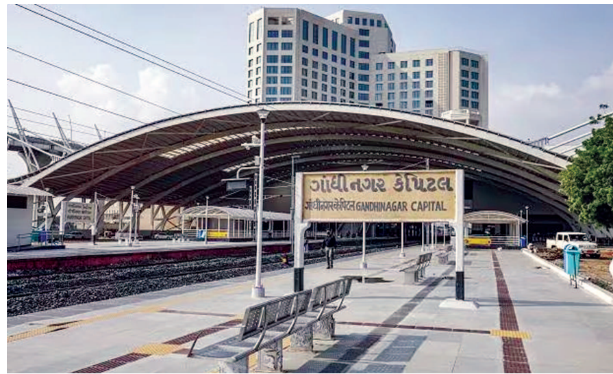
પાસે અદ્યતન લીલા હોટલ દેશમાં પહેલી છે પરંતુ ગાંધીનગર કેપીટલ સુવિધાઓ પ્રાપ્ત થતી નથી. ત્યારે અમદાવાદ સુધી આવતી પાંચ માંગણી છે. આ ઉપરાંત પાટનગર ગાંધીનગર કેપીટલ રેલ્વે સ્ટેશન

આંતરરાષ્ટ્રીય કક્ષાએ મુખ્ય મથક શહેર બની ગયું છે. રેલ્વે સ્ટેશન રેલ્વે સ્ટેશનમાં શહેરીજનોને જરૂરિયાત જેટલી ટ્રેનોની ટ્રેનોને વાયા ગાંધીનગર સુધી લંબાવવા માટે શહેરીજનોની