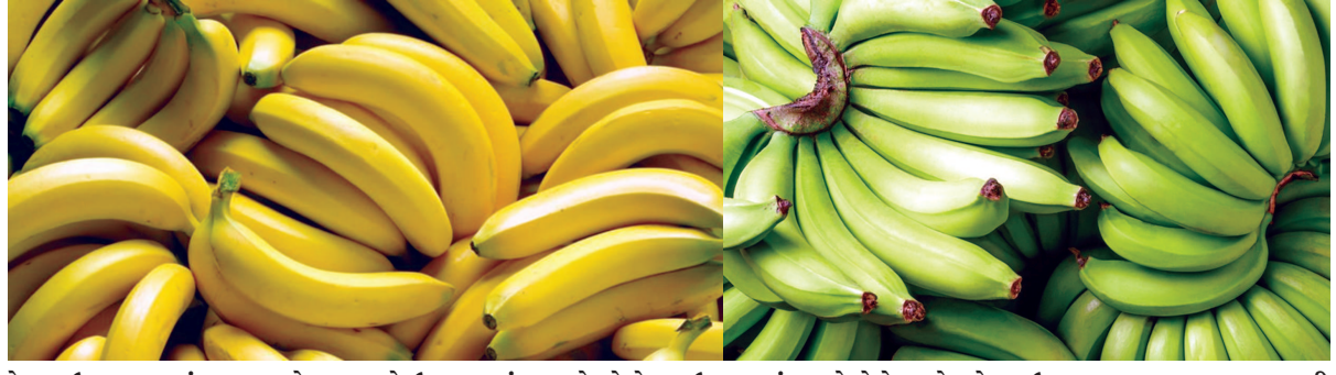
કેળાનું ઉત્પાદન જ્યાં વધુ થાય છે તેવા દક્ષિણ ગુજરાત અને મહારાષ્ટ્રમાં કમોસમી વરસાદના કારણે ઉત્પાદનમાં ખાસ્સો એવો ઘટાડો થયો છે. વડોદરા તરફના વિસ્તારમાં શહેરીકરણ વધતા કેળાના ઉત્પાદનમાં ખાસ્સો એવો ઘટાડો થયો છે. વળી આ વર્ષે કેળામાં મોઝેક અને કર્પા નામનો રોગ આવ્યો હોવાથી ઉત્પાદન ૫૦ ટકા કરતા પણ ઘટી ગયું છે. જેના કારણે એક ડાઝન કેળાનો ભાવ ૧૦૦ રૂ. પહોંચ્યો છે.

અને તેનો માલ ઓછો આવતા હાલમાં બજારમાં પણ તે ઓછા જોવા મળે છે. ગણ્યા ગાંઠ્યા વેપારીઓ જ કેળા વેચે છે. ભાવ વધુ હોવાથી સ્વાભાવિક રીતે જ તેની ખરીદી ઓછી થાય છે. હાલમાં જ ચૈત્રી નવરાત્રી પૂર્ણ થઈ તેવા સમયમાં ઉપવાસ કરનારાઓને કેળાના વધુ ભાવોએ દઝાડ્યા હતા. ઉપવાસીઓએ કેળાનો ઉપયોગ ઘટાડી દીધો હતો. અન્ય ચીજવસ્તુઓથી ફરાળ કર્યો હતો. જાણકારોના મત અનુસાર