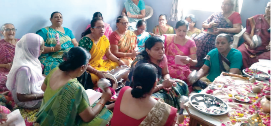
સેક્ટર ૩ એ ન્યુ ખાતે વૃંદાવન મંડળ દ્વારા આનંદના ગરબાનું આયોજન કરવામાં આવ્યું હતું.