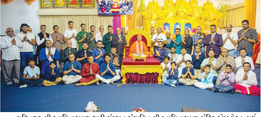
મણિનગર શ્રી સ્વામિનારાયણ ગાદી સંસ્થાન સંચાલિત શ્રી સ્વામિનારાયણ મંદિર એમ્બલેટન, પર્ય - ઓસ્ટ્રેલિયામાં બિરાજમાન ધનશ્યામ મહારાજનો પ્રથમ વાર્ષિક પ્રતિષ્ઠોસ્તવની પરમ ઉલ્લાસભર ઉજવણી કરાઈ હતી.