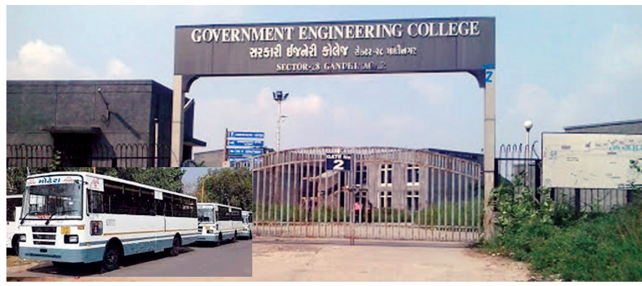
ગાંધીનગર બસ સ્ટેન્ડ અથવા સે-૨૮/૨૮ સ્ટેન્ડ સુધીની જ હોવાથી વિદ્યાર્થીઓને કોલેજ સુધી જવામાં મુશ્કેલીનો સામનો કરવો પડતો હતો. એસટી નિગમ દ્વારા પાસની સુવિધા અપાય છે પરંતુ તે અમુક સ્થળ પુરતી મર્યાદિત બની જાય છે. સેક્ટર-૨૮ સરકારી ઈજનેરી કોલેજના વિદ્યાર્થીઓ તેમજ અધ્યાપકોએ એસટી નિગમને

ગાંધીનગર, તા. ૧૦ સેક્ટર-૨૮ સ્થિત સરકારી ઈજનેરી કોલેજના વિદ્યાર્થીઓ અને કર્મચારીઓ અમદાવાદથી આવતી બસ કોલેજ સુધી ન આવતા અવર-જવરમાં મુશ્કેલી થતી હતી. વિદ્યાર્થીઓની લેખિત રજુઆતને ધ્યાનમાં લઈ એસટી નિગમે બસોની સે-૨૮ સુધી લંબાવવાની સુવિધા પુરી પાડી છે.