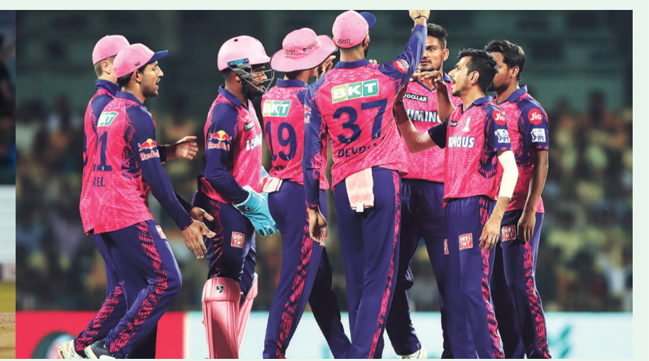
રોમાંચક મુકાબલો - મોટેરાના નરેન્દ્ર મોટી સ્ટેડિયમ ખાતે રાજસ્થાન રોયલ અને ગુજરાત ટાઈટન વચ્ચેના ક્રિકેટ મુકાબલમાં ગુજરાત ટાઈટનને ૧૭૭ રન કરી ૧૭૮નો લક્ષ્યાંક રાજસ્થાન રોયલને આપ્યો હતો... ગુજરાતે ધીમી શરૂઆત બાદ મક્કમતાથી ઠાવ આગળ ધપાવ્યો હતો... પરંતુ રાજસ્થાન રોયલના બોલરોએ ગુજરાતના સ્કોરને ઝડપી વધારવામાં નિયંત્રણ લાવવામાં સફળ રહ્યા હતા... આમ છતાં ગુજરાતે ૧૭૮ રનનો લક્ષ્યાંક આપી મેચને રોમાંચક બનાવી હતી....