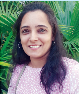
ફોરમ દેવાંગ ટાક