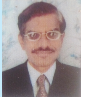
મહેન્દ્રભાઈ કે ચૌહાણ સોનાર-કચ્છ સમાજ