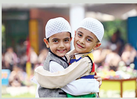
નિમિત્તે બજારોમાં ખરીદી થઈ રહી છે. નવા વસ્ત્રો અને ઘરવખરીની ચીજવસ્તુઓની ખરીદી તેજ બની છે. ઈદનો તહેવાર હર્ષોલ્લાસનો તહેવાર હોઈ ખાણીપીણીની ચીજવસ્તુઓ બનાવવાની તૈયારીઓ થઈ રહી છે. ખાસ કરીને ઈદના દિવસે સવારે બનાતી શીરખુરમાની તૈયારીઓ ગૃહિણીઓએ કરી દીધી છે.

ગાંધીનગર, તા. ૨૦ રમઝાન માસ પૂર્ણતાના આરે પહોંચ્યો છે. એક માસના રોઝા-ઉપવાસ અને ઈબાદત બાદ શનિવારે ઈદ ઉલ ફીત્રની ઉજવણી કરવામાં આવશે. ઈદ ઉલ ફીત્રની વિશેષ નમાઝનું આયોજન મસ્જીદોમાં કરવામાં આવ્યું છે. મુસ્લિમોના પવિત્ર રમઝાન માસ હાલમાં ચાલી રહ્યો છે. રમઝાન માસના રોઝા હવે પૂર્ણતાના આરે છે. મુસ્લિમ બિરાદરો ઈબાદતમાં મશગુલ બન્યા છે. ઉનાળાના દિવસો દરમિયાન રોઝા આકરા બની રહ્યા છે. રોઝા પૂર્ણ થતાં શનિવારે ઈદ ઉલ ફીત્ર (ઈદ)ની ઉજવણી કરવામાં આવશે. ઈદની ઉજવણી