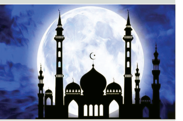
આ ઉપરાંત અન્ય ફરસાણ પણ બનાવવામાં આવી રહ્યા છે. ઈદની ઉજવણી નિમિત્તે શહેરની મસ્જીદોને રોશનીથી શણગારવામાં આવી છે. મસ્જીદો રોશનીથી ઝળહળી રહી છે. મસ્જીદોની અંદર કુરઆનની તિલાવતોનું આયોજન થયું છે. ઈદની વિશેષ નમાઝની તૈયારીઓ ઈદગાહ અને શહેરની મસ્જીદોમાં થઈ રહી છે.