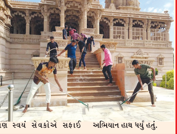
પણ સ્વયં સેવકોએ સફાઈ અભિયાન હાથ ધર્યું હતું.

પ્રામ વિગતો અનુસાર તા. ૨૨ એપ્રિલના રોજ જિલ્લાના વિવિધ વિસ્તારોમાં ખાસ સફાઈ ડેબેનિશનું આયોજન થયું હતું. જેમાં ખેડબ્રહ્મા માતાજી મંદિરે સવારે ૮-૦૦ કલાકે સફાઈ અભિયાન-૨૦૨૩નું સવારે ૮-૦૦ કલાકથી