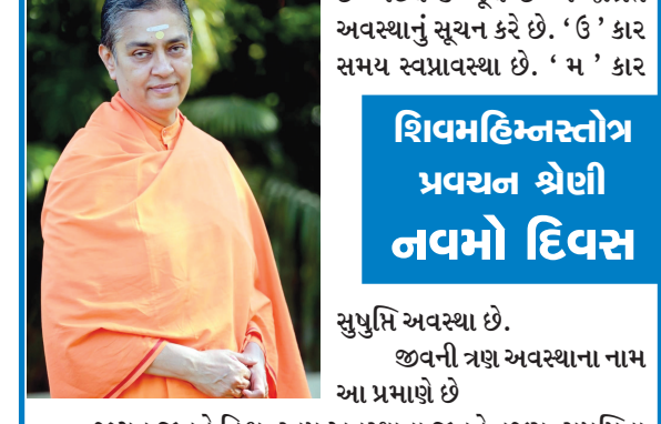
શિવમહિન્સતોત્ર પ્રવચન શ્રેણી નવમો દિવસ સુષુપ્તિ અવસ્થા છે. જીવની ત્રણ અવસ્થાના નામ આ પ્રમાણે છે

આચાર્ય પુષ્પદંતજીની દ્રષ્ટિમાં ભગવાન લિંગ, મૂર્તિ કે સ્થાનમાં રહ્યા નથી. સમસ્ત જગત શિવમય છે. અદ્યતન વુભૂતિ રૂપે સમસ્ત જગતમાં પ્રગટ છે. રમણ મહર્ષિ કહે છે જગત ભગવાનની અદ્યતન મૂર્તિ જ છે. પ્રણવ, ઓમકાર એ ભગવાનનું એવું નામ છે જે સગુણ-નિર્ગુણ બંને સ્વરૂપને દર્શાવે છે. શ્ર્લોક : ૨૭ આચાર્યજી ભગવાનને સંબોધન કરે છે. 'શરણદ' અર્થાત્ દરેકને પોતાનામાં શરણ આપનાર આપનું શરણ ન મળે તો કોઈ જીવ સુષ્ટિ પર ટકી શકે નહીં. 'ઓમકાર' પરમાત્માનું એકાક્ષરી નામ છે. જેમાં ઈશ્વરના સમસ્ત સ્વરૂપનો નિર્દેશ થઈ જાય છે. ઓમકાર માં કાર એ સ્વર છે, 'ઉ' કાર પણ સ્વરૂપ છે. જ્યારે 'મ' કાર વ્યંજન છે. આ નું વ્યસ્ત સ્વરૂપ છે. એ પરમાત્માનું નામ છે. એની ત્રણ માત્રાથી સમસ્ત જગતનું સૂચન થઈ જાય છે. માત્રા એટલે ઉચ્ચારણ કરવાનો સમય ઉ સ્વર-વ્યંજન ત્રણ વેદનો નિર્દેશ કરે છે. અને ત્રણ અવસ્થા જાગ્રત-સ્વપ્ન-સુષુપ્તિનો નિર્દેશ કરે છે. ઓમકારના ઉચ્ચારણ સમયે કારનો ઉચ્ચાર કરો તો મુખ ખૂલે છે. 'ઉ' કાર ના ઉચ્ચાર સમયે મુખ અડધું ખૂલે છે. 'મ' ના સમયે ઓઘ જોડાય છે મુખ વિકસિત થાય છે એટલે કે ખૂલે છે એ જાગ્રત અવસ્થાનું સૂચન કરે છે. 'ઉ' કાર સમય સ્વપ્નપ્રાવશ્ય છે. 'મ' કાર સમય સ્વપ્નપ્રાવશ્ય છે.