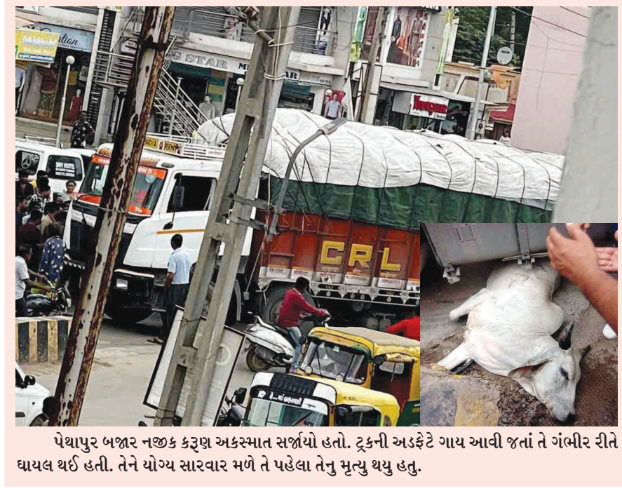
પેશાપુર બજાર નજીક કરૂણ અકસ્માત સર્જાયો હતો. ટૂકની અડફેટે ગાય આવી જતાં તે ગંભીર રીતે ઘાયલ થઈ હતી. તેને યોગ્ય સારવાર મળે તે પહેલા તેનું મૃત્યુ થયું હતું.