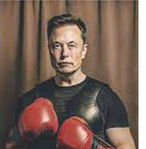
સાહસિક ઈલોન મસ્કે જાહેરાત કરી છે કે તે સીટ ના અઈ માર્ક ઝકરબર્ગ સાથે કેજ ફાઈટ કરશે જેનું ૬ પર