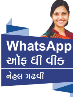
WhatsApp ઓફ ઈ વીડ નેહલ ગઢવી

વધારો જોવા મળે છે! મનગમતી વસ્તુ કરવાનો થાક કે કંટાળો આપણને ક્યારેક આવતો નથી કે તેના માટે કોઈ extra efforts પણ કરવા પડતા નથી. અને માટે જ આવા પ્રકારની પ્રવૃત્તિઓ આપણા વ્યક્તિત્વને વિકસાવવા માટે અત્યંત જરૂરી છે. મહત્વનીશનલ કંપનીમાં કામ કરતા એન્જનીયરિંગ હોય કે કોર્પોરેટ હોસ્પિટલમાં કામ કરનારા ડોક્ટર અથવા તમામ પોતાના hectic schedule વચ્ચે પણ કોઈ એકાદ મનગમતી પ્રવૃત્તિ કરવા માટેનો સમય ફાળવી જ લેતા હોય છે! એક સર્વે અનુસાર આજકાલ ઓબેસીટી અને માનસિક રોગોની તકલીફ લોકોમાં ખૂબ મોટા પ્રમાણમાં જોવા મળે છે. આ પ્રકારની તકલીફો જો નિવારવી હશે તો આપણે આપણી hobby કે મનગમતી પ્રવૃત્તિ માટે જરૂરી સમય પણ ફાળવવો જ પડશે! કોઈ એકાદ sports કે જે શાળાજીવનમાં અત્યંત મનગમતી રમત હતી અને હવે સમયના